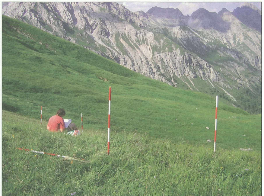
Abb. 3: Erstellen einer Referenzfläche im Untersuchungsgebiet Riebenkofel.

flächen bei Wiederholungsaufnahmen erleichtern (Abb 2, 3).