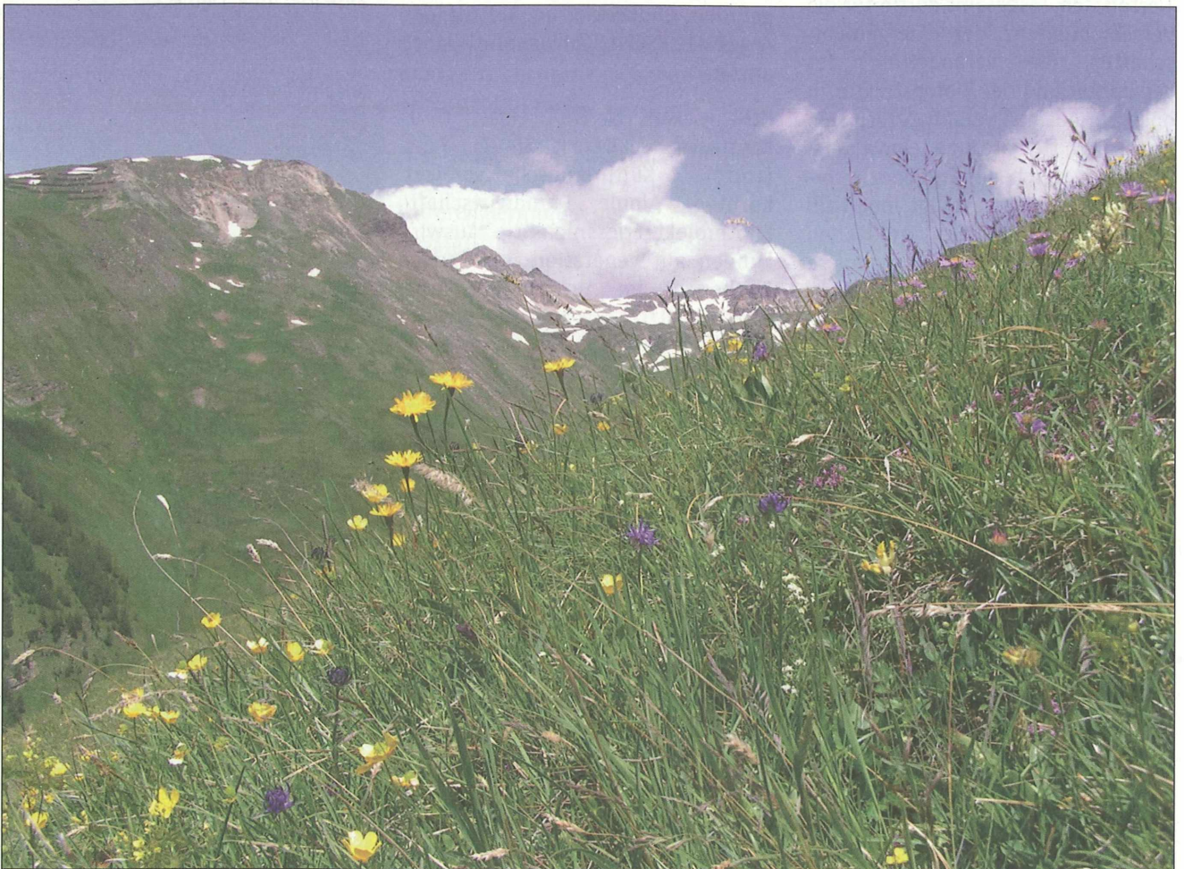
Abb. 1: Artenreiche, halbschürige Bergmahdfläche im Untersuchungsgebiet Fleißtal, Heiligenblut.

Dabei wurde nicht nur der aktuelle Status quo der Bergmähder erhoben, sondern auch die Basis für ein langfristiges Monitoring gelegt. Damit können Veränderungen in der Vegetation