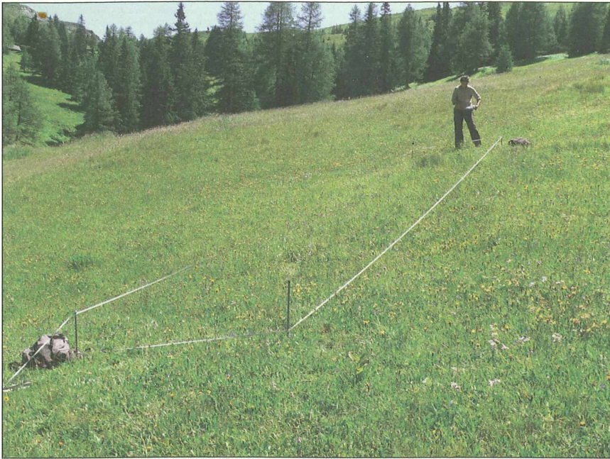
Abb. 4: Pflanzenaufnahme auf einer der Referenzflächen (2 x 10 m) im Gontal.

(ca. 2 x 50 m), erfolgte die Zählung der Individuen (Blühsprosse) so genannter Leitarten. Als solche „Leitarten“ wurden Arten ausgewählt, die als charakteristisch für extensiv genutzte artenreiche Bergmäher gelten können und bei Aufgabe oder Intensivierung der Nutzung verschwinden oder in deutlich geringerer Zahl auftreten wie z.B. Arnica montana (Arnika), Dianthus superbus (Pracht-Nelke), Ligusticum mutellina (Alpen-Mutterwurz), Pedicularis elongata (Langähren-Läusekraut), Hypochoeris uniflora (Einblütiges Ferkelkraut, Abb. 5), Nigritella nigra (Schwarzes Kohlröserl, Abb. 6), Gymnadenia conopsea (Mücken-Händelwurz), Traunsteinera globosa (Kugelorchis).