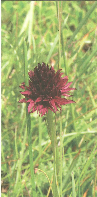
Abb. 6: Leitartenmonitoring entlang eines 2 x 50 m Transektes: Schwarzes Kohlröserl ( Nigritella nigra ).

gen. Sie dient der Einschätzung ob die Fläche überhaupt den Zertifizierungsrichtlinien für „Kärntner Almheu“ entspricht (siehe www.almheu.at ).