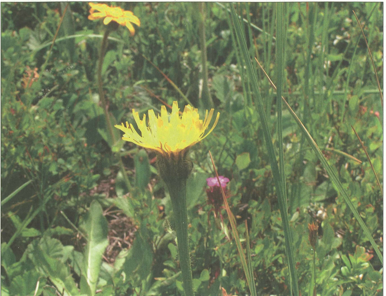
Abb. 5: Leitartenmonitoring entlang eines 2 x 50 m Transektes: Einblütiges Ferkelkraut ( Hypochoeris uniflora ).

Die Erhebung der Bewirtschaftungsweise erfolgte mittels Befragungsbo-