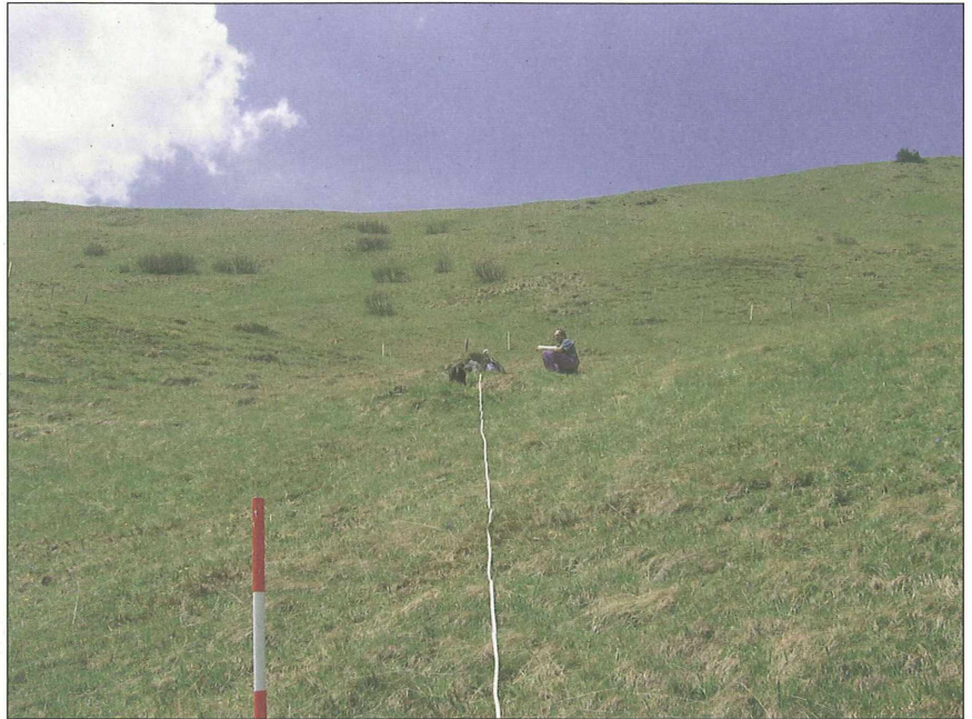
Abb. 2: Einmessen einer Referenzfläche in den Nockbergen, Ebene Reichenau.

Auf jeder Bergmahdfläche wurden ein bis drei Referenzflächen von 2 x 10 m für Pflanzenaufnahmen und ein zukünftiges Monitoring angelegt. Die Flächen wurden subjektiv in möglichst charakteristischen Bereichen der Wiese ausgewählt, eingenordet und georeferenziert (LIEB & JUNGMEIER 2006). Im Gelände wurden die Flächen mit Einmessungspunkten (Plastikplättchen auf Metallrohren) markiert. Die Verortung fand sowohl mit GPS als auch mit Maßband und Kompass statt. Später wurden die Daten in ein geografisches Informationssystem gebracht und mit Hilfe von Orthofotos korrigiert. Im GIS erstellte Karten sollen zusammen mit den GPS-Koordinaten die Auffindung der Referenz-