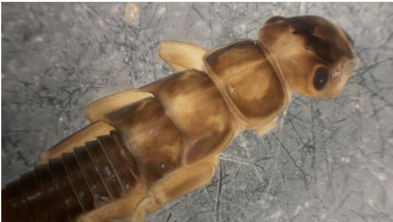
Besdolus imhoffi

Im Folgenden werden diese Tiere kurz tabellarisch zusammengefasst und nach Großgruppen besprochen. In der Tabelle wurden die Tiere nach Großgruppen gegliedert aufgelistet und mit den entsprechenden Literaturzitationen versehen.