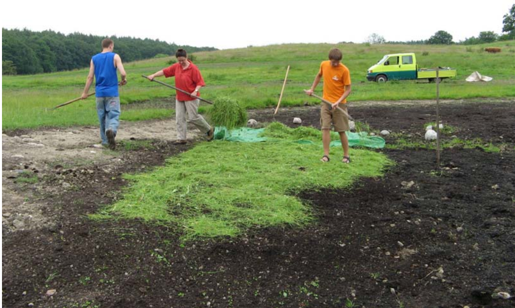
Abb. 2: Übertragung von Mahdgut mit hoher Dichte von Cardamine pratensis auf einer Ausgleichsfläche der Stadt Kiel.