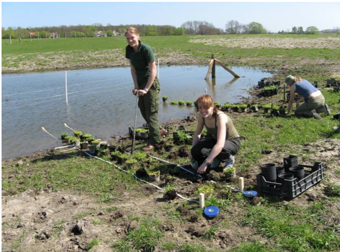
Abb. 1: Wiederansiedlung von Apium repens durch Mitarbeiterinnen der Universität Hamburg im Rahmen des Baltcoast-Projektes.

Bisher wurden mit dem autochthonen Pflanzenmaterial (jeweils 200 Töpfe, bestehend aus jeweils einer Jungpflanze, älteren Pflanzen mit Ausläufern und ganzen Wiesenausschnitten mit mehr als 6 Pflanzen) des Vorkommens aus den Sundwiesen drei neue Standorte an frisch angelegten Teichrändern in der Eichholzniederung (in 2007), dem Sehlendorfer Binnensee (in 2007) und dem Neustädter Binnenwasser (in 2008) besiedelt. Erste Ergebnisse des Monitorings sind Erfolg versprechend. BURMEIER & JENSEN (2009: 9) schlussfolgern, dass Ansiedlungen für den Kriechenden Scheiberich ein geeignetes Mittel sind, die räumliche Isolation des seltenen Doldenblüters aufzubrechen und die Art zu schützen.