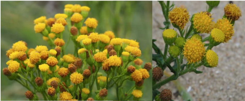
Abb. 1: Blüten von S. jacobaea subsp. dunensis mit den typischerweise fehlenden Zungenblüten

In Sanddünen tritt S. jacobaea häufig insbesondere mit den dort etablierten Grasarten in Konkurrenz. Oft treten in unmittelbarer Nähe Pflanzen wie der gewöhnliche Strandhafer ( Ammophila arenaria ), Sanddorn ( Hippophae rhamnoides ), Stranddistel ( Eryngium maritimum ), echtes Labkraut ( Galium verum ), Bibernelle-Rose ( Rosa spinosissima ) sowie Rubus - und Viola -Arten auf (Harper und Wood 1957).