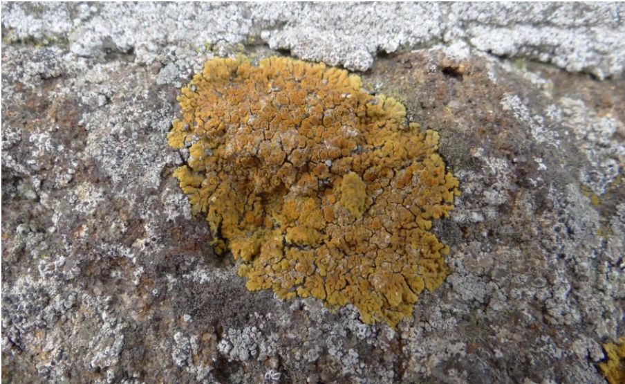
Abb. 1: Hepps Schönfleck ( Caloplaca flavescens ) auf einem kalkimprägnierten Stein der alten Kirche auf Pellworm

doch vorwiegend auf anthropogenen kalkhaltigen Gesteinen, überwiegend auf Mörtel, vor. In Schleswig-Holstein ist die Art in größeren Beständen auf dem Buntsandsteinsockel der Insel Helgoland an einem natürlichen Standort anzutreffen, während sie auf dem Festland fast nur noch an alten Kirchen und selten an alten Grabsteinen zu finden ist. Erichsen (1957) schreibt zu den Vorkommen in Nordwestdeutschland (hier unter Caloplaca aurantia (Pers.) Hellb. und C. heppiana (Müll.Arg.) Zahlbr.): »Im Gebiet fast ausschließlich an Mörtel, Kalkbewurf und Backsteinen alter Gemäuer, meistens an Landkirchen. Selten auf eingemauerte, also nicht ganz kalkfreie Granitblöcke übergehend.« Die Art wird, mit Ausnahme der Regionen, in denen die Kirchenmauern weiß gestrichen wurden, als häufig bezeichnet. Aufgrund des starken Bestandsrückgangs, verursacht unter anderem durch Restaurierungs- und Reinigungsmaßnahmen an alten Kirchen und Grabsteinen, wird Caloplaca flavescens in der aktuellen Roten Liste (Dolnik et al. 2010) in ihrem Bestand als stark gefährdet (RL 2) eingestuft. Dort, wo die Art heute noch vorkommt, sind auch andere seltene und gefährdete Flechten zu erwarten und die Standorte erhaltenswert. Die aktuell bekannte Verbreitung der Art in Schleswig-Holstein ist aus der Verbreitungskarte (Abbildung 2) zu entnehmen.