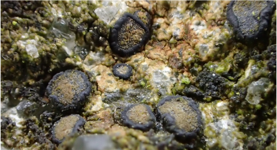
Abb. 4: Dickrandige, bereifte Apothecien von Lecidea sarcogynoides auf einem Grabstein auf dem Friedhof Satrup, Mittelangeln (Foto: C. Dolnik).

1830/2 OH: Kniphagen, östlicher Waldrand des Kniphagener Holzes, auf gefällten Eschen, tlw. mit reichlich Apothecien, 10/21, PN & CD.