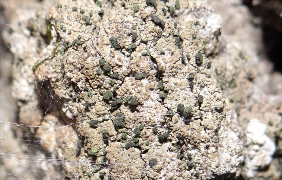
Abb. 1: Die Sitzende Kelchflechte ( Calicium adpersum ) ist charakteristisch für tiefrissige Borke sehr alter Eichen. Typisch ist das leicht schuppige Lager mit den kurz gestielten bis fast sitzenden, grüngelblich bereiften Apothecien. Die Art ist, auch aufgrund der in den letzten Jahrzehnten stattgefundenen starken Dezimierung geeigneter Trägerbäume bei uns akut vom Aussterben bedroht. Alteiche bei Pronstorf, Kreis SE.