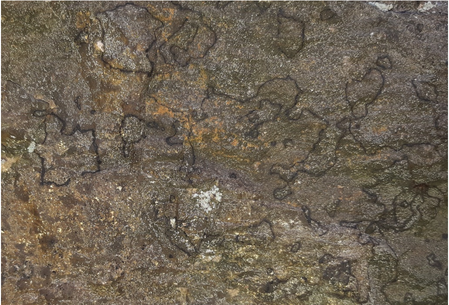
Abb. 3: Bestand der Mosaik-Zeichenflechte ( Enterographa zonata ) an einem alten Blockwall im Waldgebiet Bollhusen südlich von Schierensee, Kreis RD.

Erst der zweite aktuelle Fund der auf offene Pionierstandorte angewiesenen, relativ unscheinbaren Art.