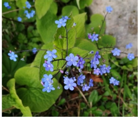
Abb. 4: Blütenstand und Habitus von Omphalodes verna (Frühlings-Gedenkemein, links) und Brunnera macrophylla (Kaukasus-Vergissmeinnicht, rechts) in der Aufsicht.