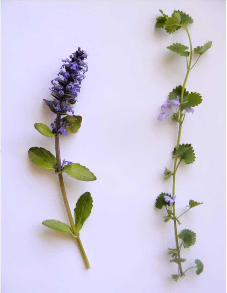
Abb. 2: Kriechender Günsel ( Ajuga reptans L.) und Gundermann ( Glechoma hederacea L.).