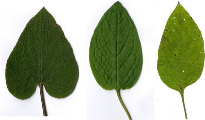
Abb. 6: Grundblätter von Brunnera macrophylla (Kaukasus-Vergissmeinnicht), Omphalodes verna (Frühlings-Gedenkemein) und Pentaglottis sempervirens (Spanische Ochsenzunge). Die Blattstiele sind verkürzt dargestellt, die Größenverhältnisse sind einander angeglichen. → Bogenlinie, entstanden dadurch, dass die Seitennerven 1. Ordnung jeweils Anschluss an den nächsten Seitennerv finden.