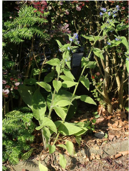
Abb. 5: Blattrosette und Habitus von Pentaglottis sempervirens (Fotos J. Hebbel).