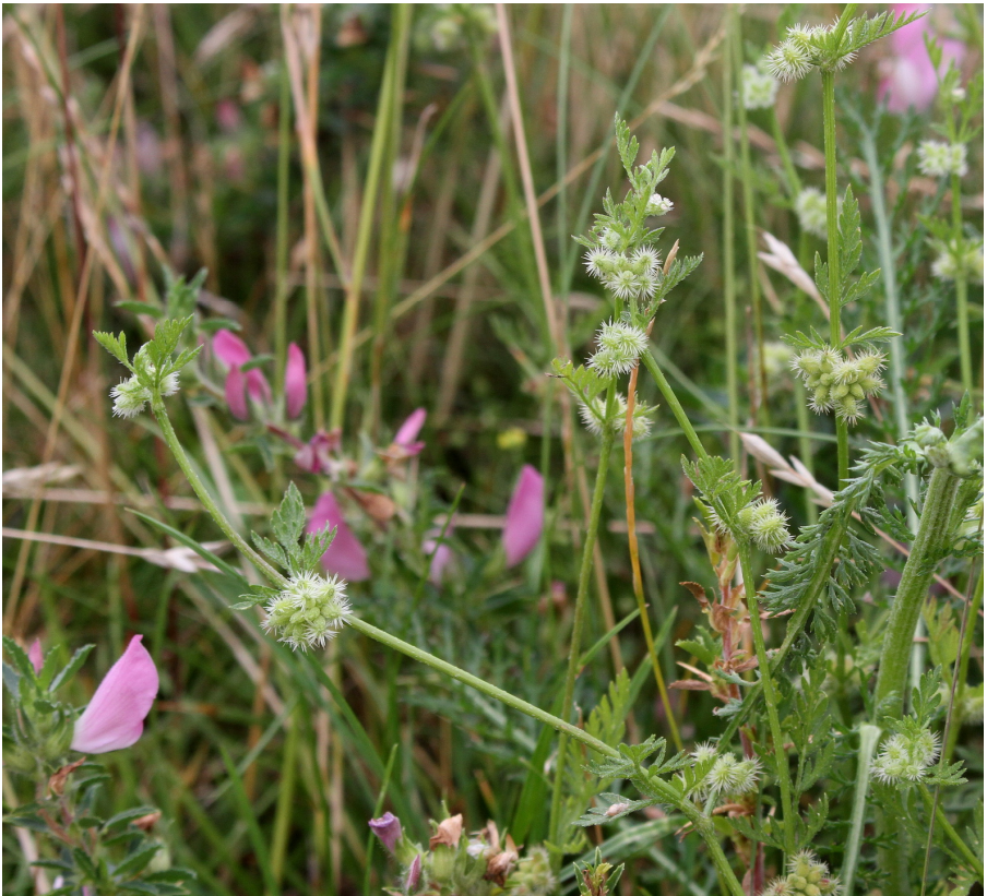
Abb. 16: Knäuel-Klettenkerbel ( Torilis nodosa ), Friedrichskoog 22.7.2022