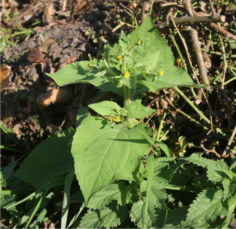
Abb. 11: Siegesbeckie ( Sigesbeckia serrata ), Leck 11.10.2018