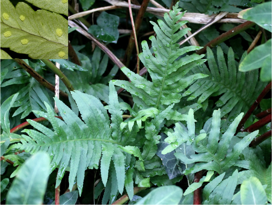
Abb. 10: Polypodium cambricum subsp. cambricum , Helgoland 7.9.2022