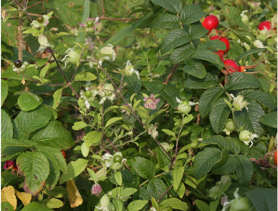
Abb. 12: Hühnerbiss ( Silene baccifera ), Niebüll, 28.8.2019

Einige weitere Fundmeldungen aus dem südlichen Holstein.