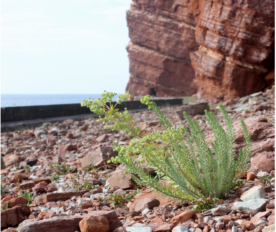
Abb. 3: Strand-Wolfsmilch ( Euphorbia paralias ), Helgoland 9.9.2022