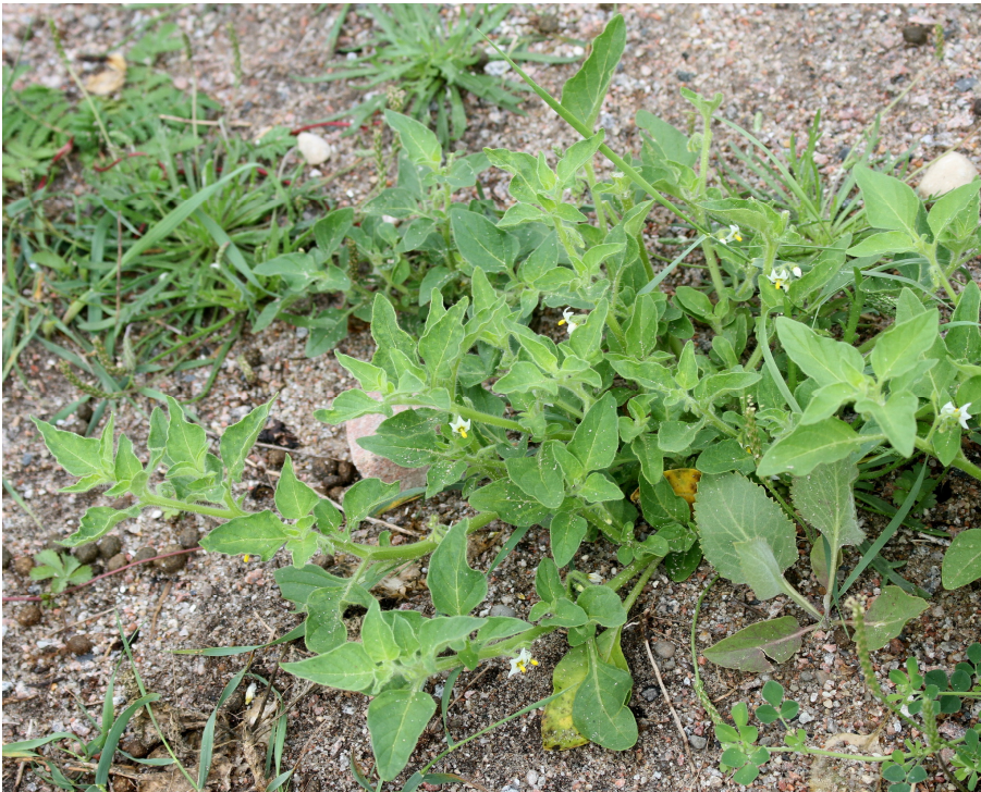
Abb. 13: Argentinischer Nachschatten ( Solanum nitidibaccatum ), Heiligenhafen 10.7.2021