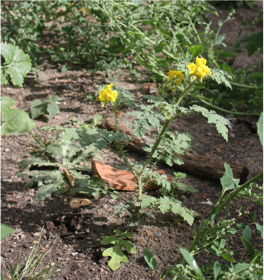
Abb. 14: Stachel-Nachtschatten ( Solanum rostratum ), Niebüll 23.8.2020