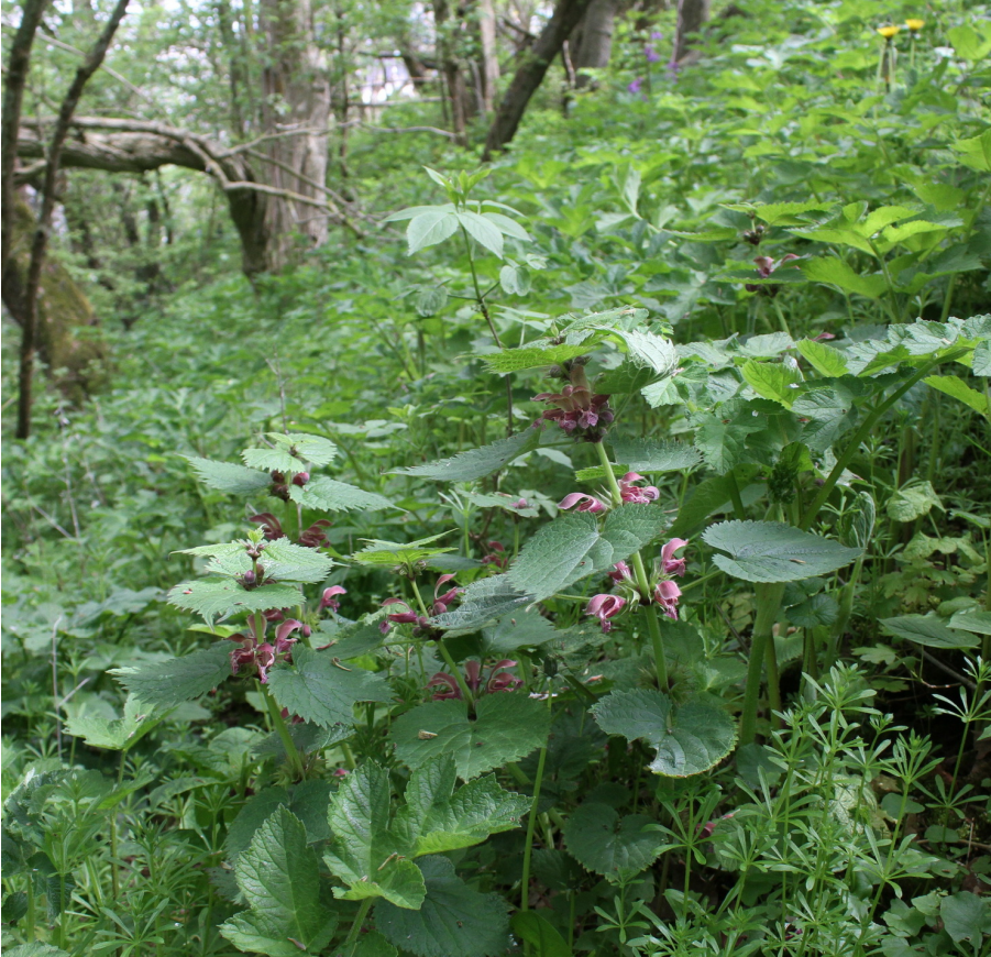
Abb. 7: Riesen-Taubnessel ( Lamium orvala ), Helgoland 18.5.2021