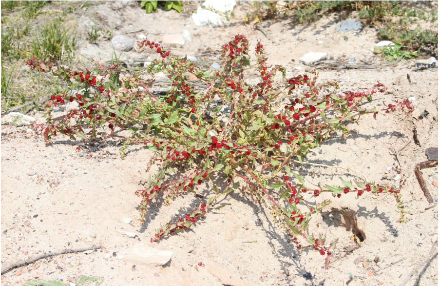
Abb. 2: Erdbeerspinat ( Blitum virgatum ), Helgoland 28.7.2019