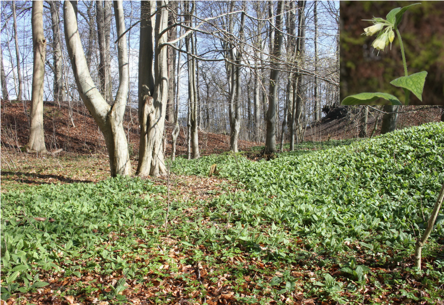
Abb. 15: Knoten-Beinwell ( Symphytum tuberosum ), Flensburg 13.4.2021 (Blütenstand 26.4.2022)

Sehr wenige Funde in Schleswig-Holstein, möglicherweise aus früherer Gartenkultur.