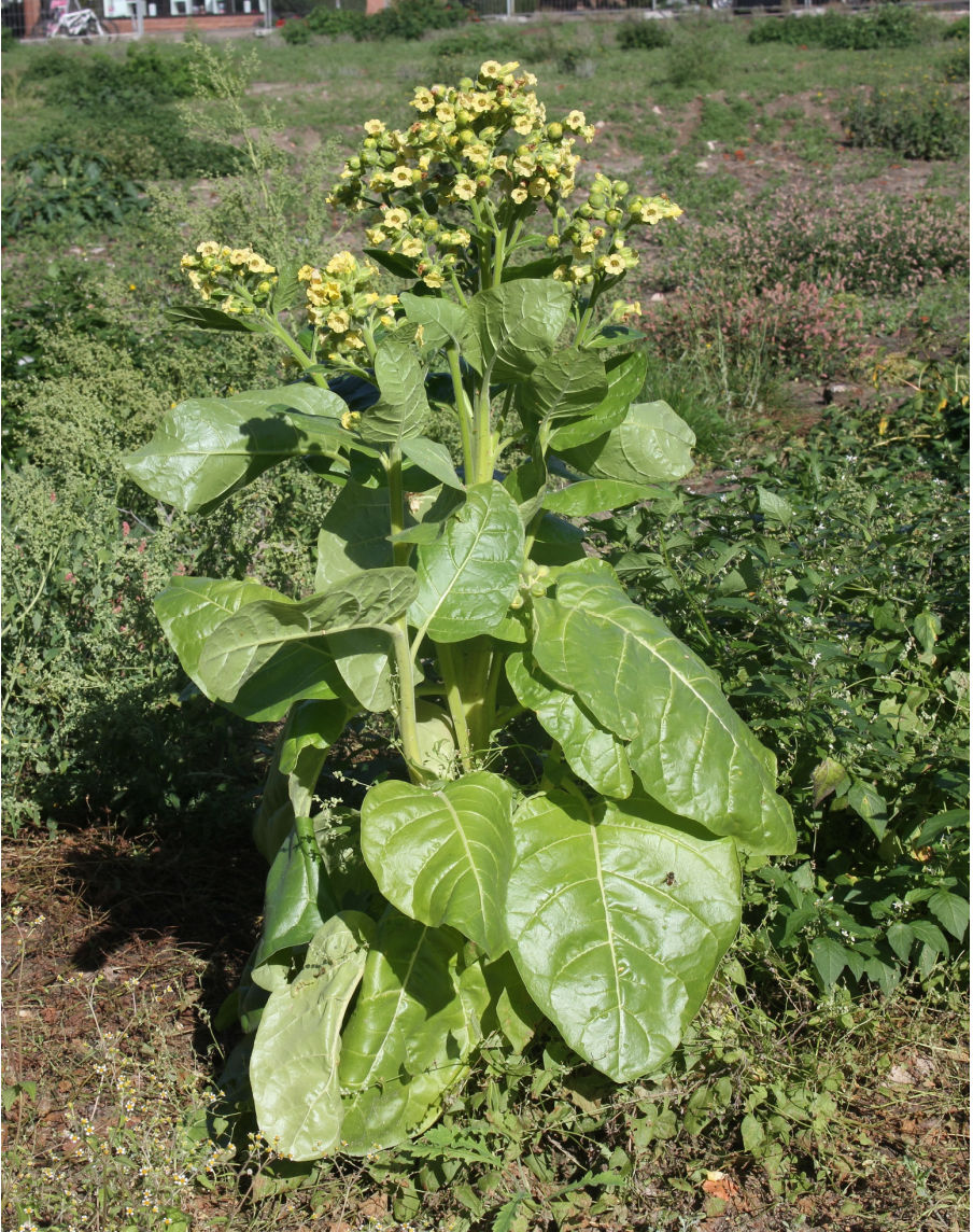
Abb. 8: Bauern-Tabak ( Nicotiana rustica ), Niebüll, 16.9.2018