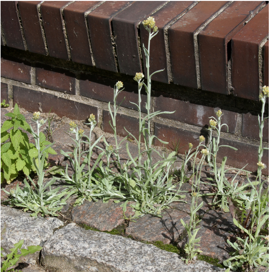
Abb. 5: Gelbliches Ruhrkraut ( Helichrysum luteoalbum ), Flensburg 8.9.2019

Für diese v. a. im östlichen Deutschland weiter verbreitete Art liegen aus Schleswig-Holstein nur sehr wenige Fundmeldungen vor.