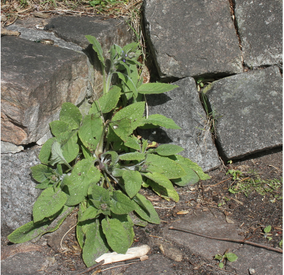
Abb. 9: Spanische Ochsenzunge ( Pentaglottis sempervirens ), Kiel 10.4.2022