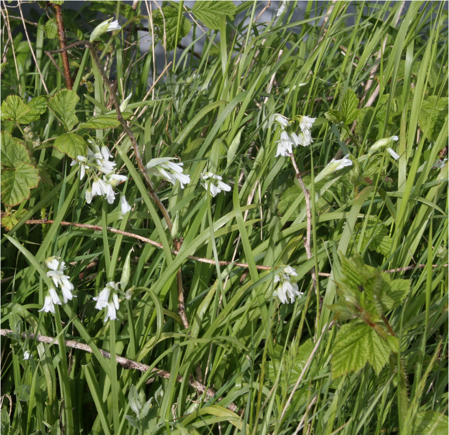
Abb. 1: Dreikant-Lauch ( Allium triquetrum ), Helgoland 18.5.2021