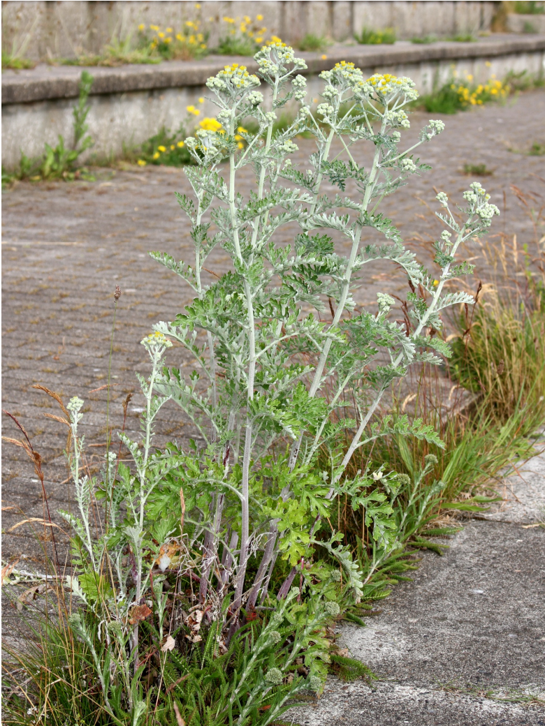
Abb. 6: Jacobaea albescens , Helgoland 27.6.2021

Die in Schleswig-Holstein seit langem etablierte Art besitzt deutlich mehr Vorkommen, als die Atlaskarte (NetPhyD & BfN 2013) zeigt. Die Verbreitung v. a. im Nordosten leitet über zu den dänischen Vorkommen an der Ostküste Jütlands. (Kæmpe-Turt, Arter 2023).