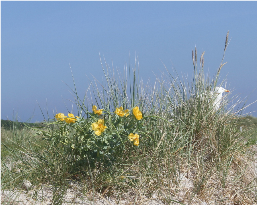
Abb. 4: Gelber Hornmohn ( Glaucium flavum ), Helgoland 25.6.2022