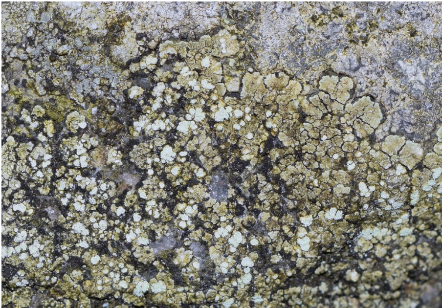
Abb. 40: Die Sorediöse Kuchenflechte ( Lecanora soralifera ) auf Granitblock im Friedenshain in Neumünster. Die Art ist aufgrund des usnin-grünen Thallus sowie der auffälligen Sorale leicht erkennbar (Foto: P. Neumann).

2020/1 HEI: Marne, Kleinbahn Marne – St. Michaelisdonn, auf Gleisschotter, 05/21, CD.