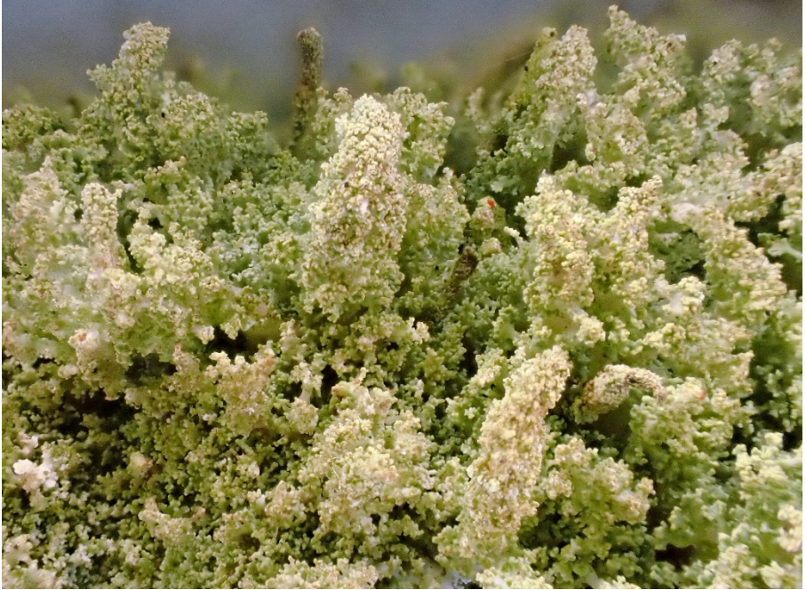
Abb 39: Die Eichen-Säulenflechte ( Cladonia parasitica ) ist typisch für morsche alte Eichenholzstubben, die sie mit feinen, schwammig-zarten Podethien überzieht. Der einzige aktuelle Nachweis in Schleswig-Holstein stammt von einer Wiese an der Bilsbek am Kummerfelder Gehege, Kreis Pinneberg.

1320/4 NF: NSG Löwenstedter Sandberge, kiesiger Offenboden in Plaggfläche nördlich des ehemaligen Bahndammes, 01/23, PN.