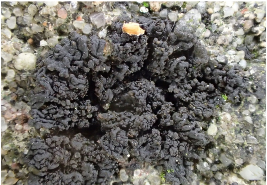
Abb. 44: Die seltene Schraders Gallertflechte ( Leptogium schraderi ) wächst als unscheinbare schwarzgraue Kruste auf Mörtel der Mauerkrone der Kirchhofsmauer in Wohltorf. Sie gehört zu den Flechten, die an Stelle von Algen mit Cyanobakterien eine Symbiose bilden und daher im trockenen Zustand schwärzlich und im feuchten aufgequollenen Zustand dunkelgrün und etwas glibberig sind.

Nach dem Erstnachweis der Art in Neumann et al. (im Druck) ist dies der zweite Fund in Schleswig-Holstein.