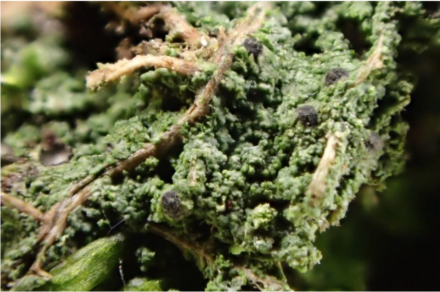
Abb. 42: Wiederfund vom Spitzes Muschelschüppchen ( Normandina acroglypta ) in der Borgsumer Vogelkoje auf Föhr auf einem mit Moos bewachsenem Silberpappelstamm nach 93 Jahren.

2030/2 OH: Niendorf, Dünen am Ostseestrand, humoser Dünensand, 10/22, CD.