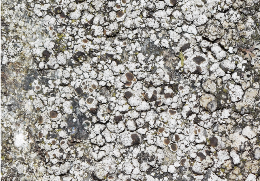
Abb. 41: Die Gescheckte Erzgebirgsflechte ( Miriquidica leucophaea ) auf Gedenkstein im Friedenshain in Neumünster.

Die recht unscheinbare Art wurde erst jüngst wieder in Schleswig-Holstein nachgewiesen (vgl. Neumann et al., im Druck).