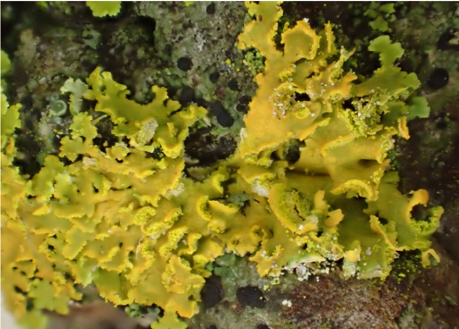
Abb. 45: Die Rinden-Gelbflechte ( Xanthomendoza huculica ) hat schwalbennestartig gewölbte Randsorale, die für die Art typisch sind. Sie wurde in Tarbek als neu für Schleswig-Holstein gefunden.

Deutschlandweit vom Aussterben bedrohte Art mit sehr starker Bindung an alte Waldstandorte. Sie wurde erst jüngst im Handewitter Forst sowie im Gehege Pöhl wiederentdeckt (vgl. Neumann et al., im Druck).