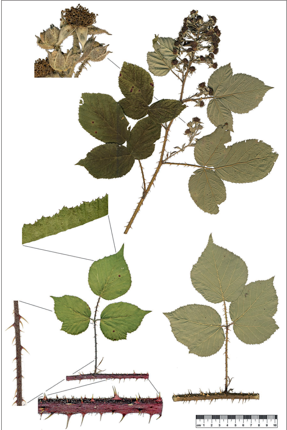
Abb. 1: Holotypus von Rubus naumannii SCHÖN.