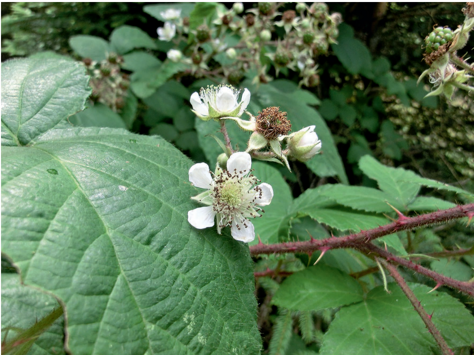
Abb. 3: Blüten von Rubus naumannii , nördlich Herschdorf, 3.8.2014 – Flowers of R. naumannii .