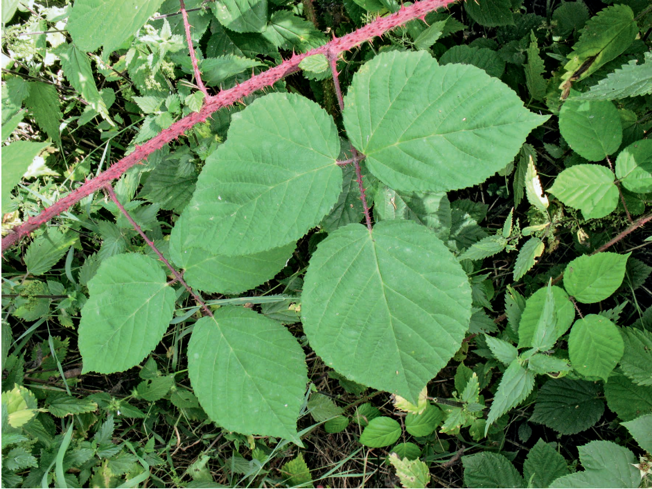
Abb. 2: Schösslingsblatt von Rubus naumannii , nördlich Herschdorf, 12.8.2013. – Primocane leaf of R. naumannii .