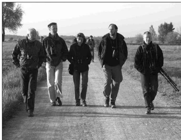
... bei der auch für Wanderungen um die Lacken Zeit war!