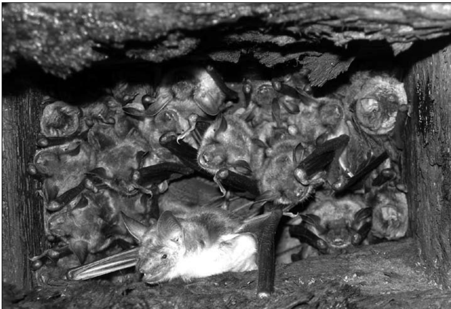
Friedliches Nebeneinander: Mausohren und Langflügel-Fledermäuse

Insgesamt war es ein würdiges Abschluss-treffen für ein mehrjähriges Projekt, in dem wir auf offizielle Weise kooperierten. Die Kontakte werden sicher über dieses Projekt hinaus bestehen bleiben, möglicherweise auch bald wieder innerhalb einer „amtlichen“ Kooperation. UH