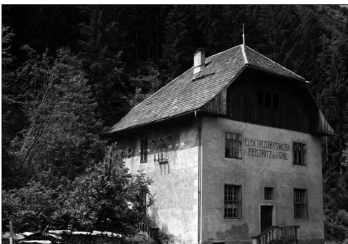
Das zukünftige Fledermaushaus in Feistritz an der Gail.