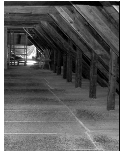
Die Hangplätze im Dachboden des Schlosses Lengberg bleiben auch nach dem Umbau erhalten.

Die Umbauarbeiten erfolgen bis zum Jahr 2010, und wir sind überzeugt, dass auch dieses Projekt beweisen wird, dass sich in solchen Fällen zumeist befriedigende Lösungen für Quartierbesitzer und Fledermäuse finden lassen!