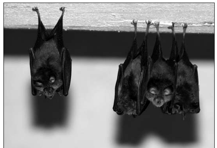
Die Bewohner des Fledermaushauses – Kleine Hufeisennasen.