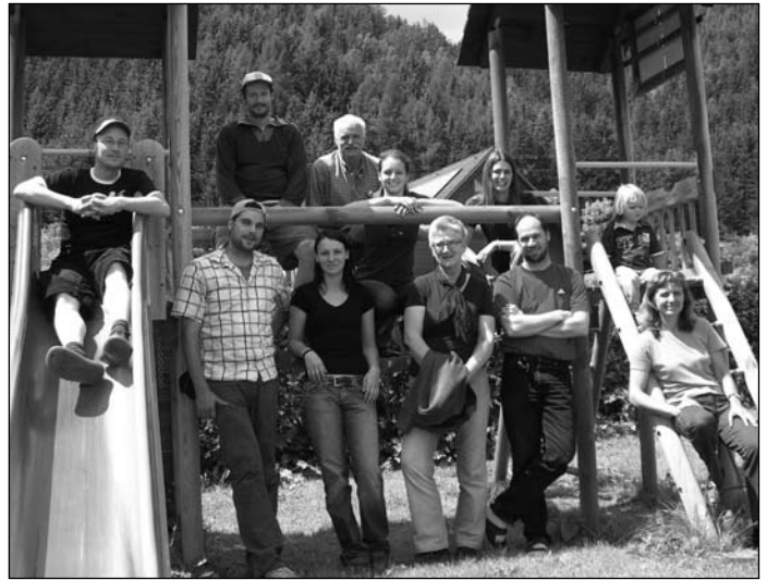
Nicht nur am Abenteuerspielplatz konnte das Kärntner Forschungs-Camp-Team etwas erleben.