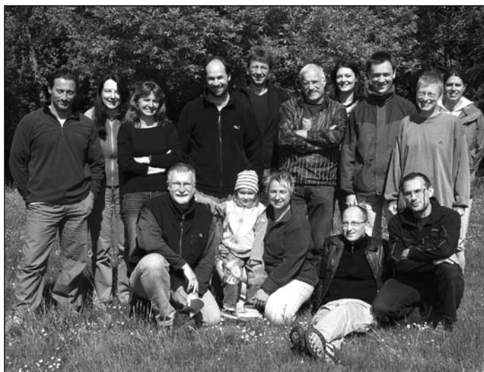
Die Teilnehmer der burgenländischen Klausur ...