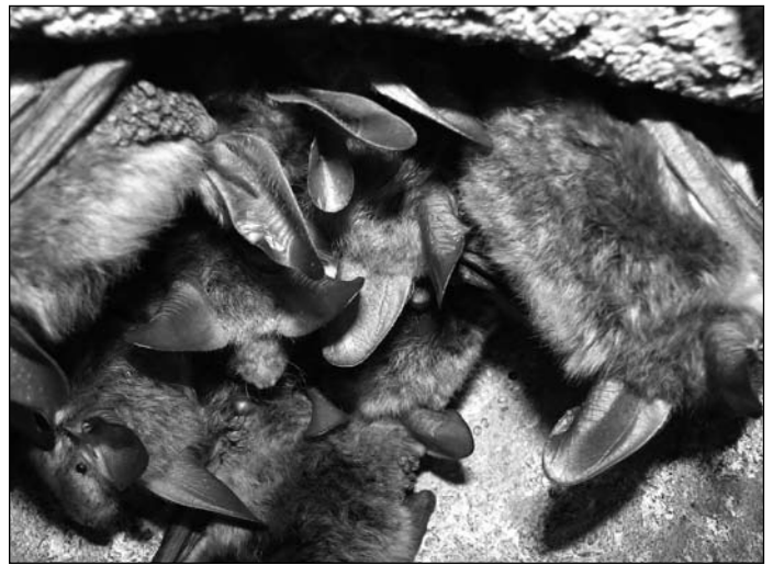
Die Bechsteinfledermäuse aus dem Machland.

Im Gegensatz dazu sollte die Sanierung des gesamten Daches der Pfarrkirche Waldhausen im Strudengau für die Tiere ohne negative Auswirkungen bleiben. Die KFFÖ wurde vom Bauamt der Diözese rechtzeitig über den Umbau informiert und so konnten die für die Fledermäuse überlebenswichtigen Maßnahmen im Einklang mit den Baufirmen durchgeführt werden.