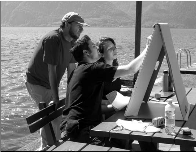
Am Seeufer und bei Sonnenschein werden die erhobenen Daten ausgewertet.