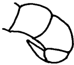
Abb. 1: Ancistrocerus dolosus nov. spec. ♂ Fühlerhaken

Diese Art ist nahe mit Ancistrocerus biphaleratus (SAUSSURE) verwandt, in der Zeichnung ist sie der ssp. triphaleratus (SAUSS.) sehr ähnlich (Binden auf den ersten drei Tergiten, Fehlen einer Zeichnung auf den Mesopleuren und dem Hinterschildchen), doch fehlt ihr die breite Endbinde auf dem 3. Tergit und die Binde auf dem 3. Tergit ist sehr schmal. Die hier beschriebene Art unterscheidet sich aber sofort von der Vergleichsart durch den kurzen und spitz zulaufenden Fühlerhaken (Abb. 1) (bei A. biphaleratus ist er breit, fingerförmig ausgebildet: Abb. 2).