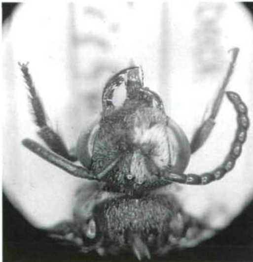
Abb. 2: Evagetus gibbulus (LEPELETIER) ♂, Caput, Foto: Jane van der Smissen

Das Exemplar ist frisch geschlüpft. Es handelt sich um einen unvollkommenen Halbseitenzwitter.