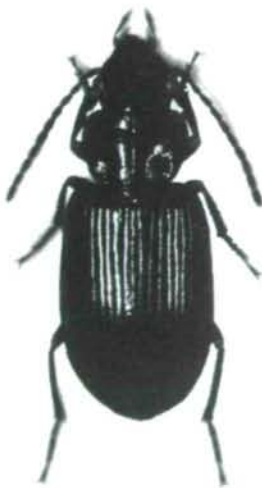
Abb. 2: Bradycellus (Tachycellus) bartschi spec. nova. Habitus (HT).

Holotypus ♂: China (C Sichuan), Qincheng Shan, 65 km NW Chengdu, 8 km W Taiping, 650-700 m (field ridge), 30.54 N/103.33 E, 18.V.1997 (cWR). Paratypen: 41♂♂, 27♀♀ mit den gleichen Daten ( TMB, MNHUB, NME, OLL, ZISP, ZSSM, cIT, cJG, cPZ, cSC, cWR). 3♂♂, 4♀♀ mit den gleichen Daten, aber: 3./4.VI.1997 (cWR).