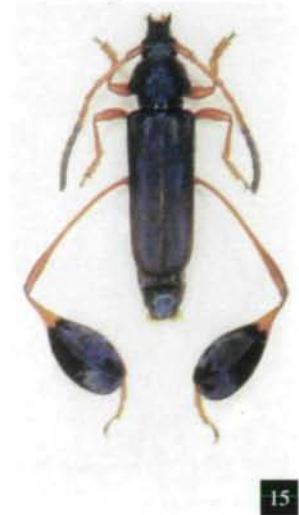
Abb. 10-15: 10 – Xystrocera sudanica , ♂, 23 mm. Abb. 11 – Allogaster aethiopicus spec. nov., Holotypus, ♂, 22 mm. Abb. 12 – Oligosmerus limbalis , ♂, 13 mm. Abb. 13 – Oxilus boulardi , ♂, 18 mm. Abb. 14 – Promeceus puncticollis comb. nov., ♂, 15 mm. Abb. 15 – Phyllocnema fairmairei , ♀, 14 mm.