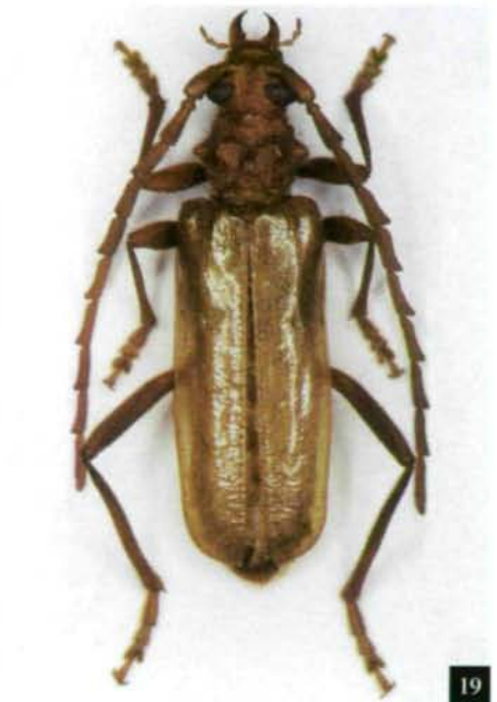
Abb. 16-19: 16 – Neoplocaederus cyanipennis , ♂, 34 mm. Abb. 17 – N. spinicornis , ♂, 35 mm. Abb. 18 – Hololeprus variolosus somalicus , ♀, 28 mm. Abb. 19 – Gahania orientalis , ♂, 21 mm.