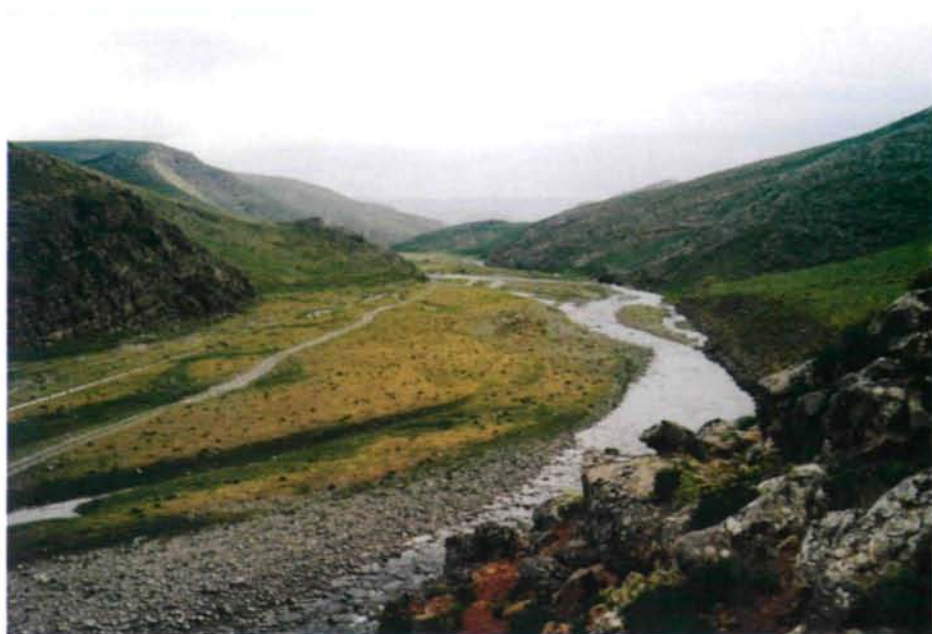
Abb. 1: Frühjahrsaspekt im Tal des Bajaldyr, ca. 600 m NN (Syrdarjinische Karatau).