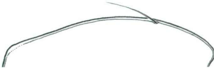
Abb. 1, 2, 3: Habitus u. Halsschildumriß, linke Seite, Dorsalansicht. 1, 2 – Parophonus knyi spec. nova (1 - Paratypus, 2 - Holotypus). 3 – Parophonus planicollis (DEJEAN) (Türkei: Izník). Maßstab 1,5 mm (Abb. 2, 3).