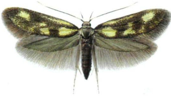
Abb. 1: Denisia fuscicapitella spec. nova (Aquarell F. Gregor).