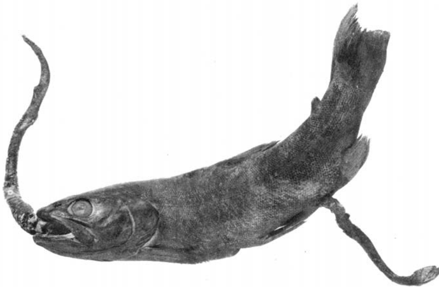
Abb. 7: Wiedergabe einer Originaltafel aus der DÖDERLEIN-Schrift "Forelle und Ringelnatter" (1910).