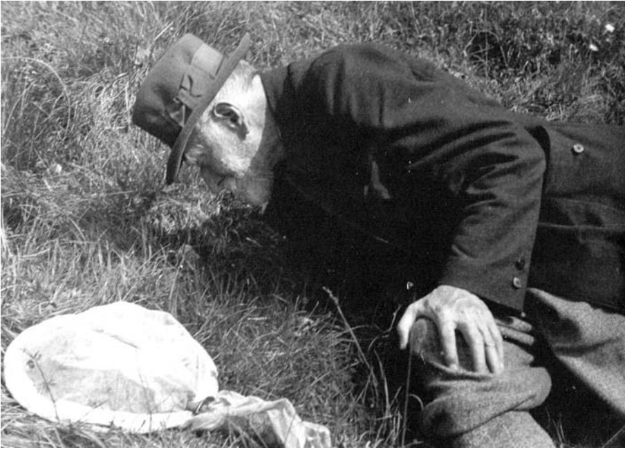
Abb. 6: Der Forscher in seinem vorletzten Lebensjahr: Ludwig DÖDERLEIN auf der Suche nach Insekten (Bodensee-Exkursion mit Studenten; Sommer 1934) (Quelle: Familienalbum DÖDERLEIN/FOLLENIUS-BÜSSOW).