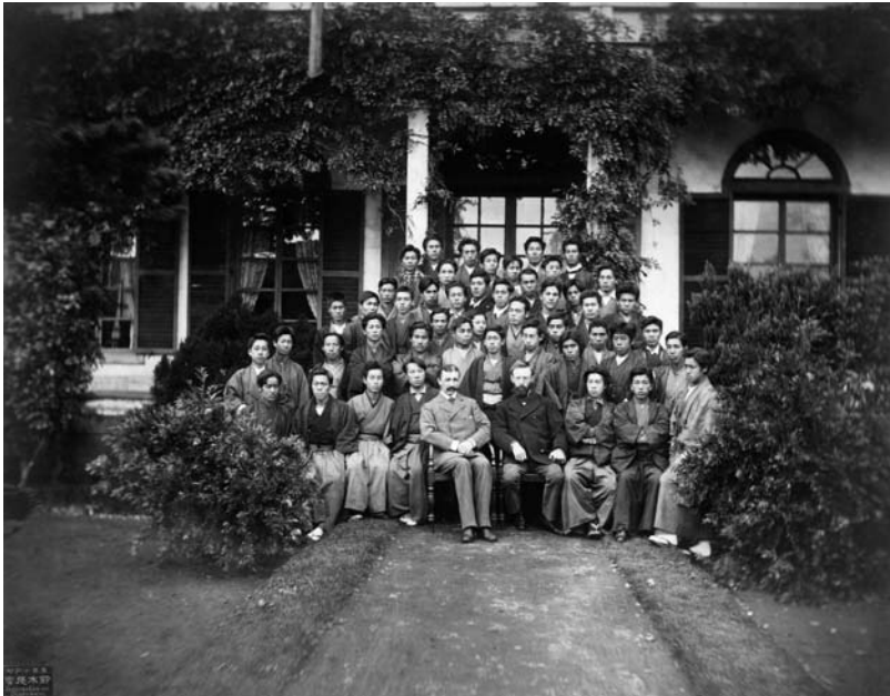
Abb. 5: Tokio 1881: LUDWIG DÖDERLEIN (vordere Reihe, vierter von rechts) im Kreise seiner japanischen Schüler, die uns in Kleidung und Haarschnitt eine recht interessante Mixtur aus traditionell japanischen und übernommenem europäischen Traditionen zeigen. Letzteres erregt des Lehrers Mißfallen (s. Text; Quelle: Familienalbum DÖDERLEIN/FOLLENIUS-BÜSSOW).