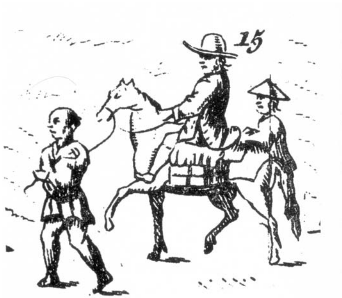
Abb. 2: Engelbert KÄMPFER im Gefolge der holländischen Gesandtschaft auf dem Weg zum Hofe des Shogun (Detail aus der Tafel XXII des Werkes "Geschichte und Beschreibung von Japan"; s. TÜRKAY 1974: 214).