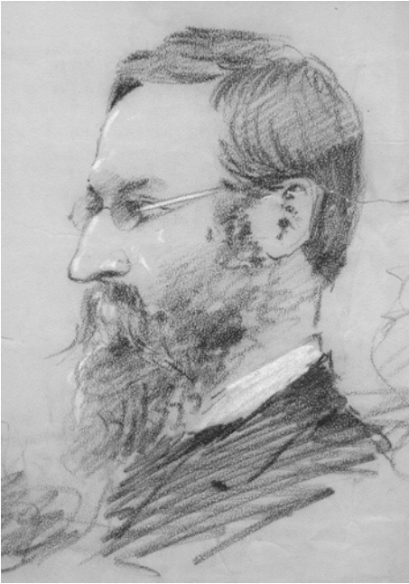
Abb 4: Ludwig DÖDERLEIN nach seiner Rückkehr aus Japan. Kreidezeichnung 31 x 24 cm, undatiert, von einem unbekanntem Künstler (aus dem Familienarchiv DÖDERLEIN/FOLLENIUS-BÜSSOW; entstanden ca. zwischen 1881 und 1885).