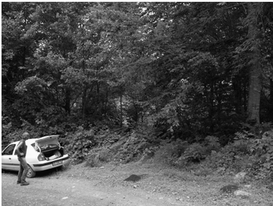
Abb. 6: Locus typicus von Leptocharis microphthalmus nov.sp mit Volker Assing.

Mittelhüften ohne auffällige Pubeszenz. Metasternalfortsatz weniger schmal und weniger lang ausgeschnitten. Am Aedoeagus sind die Parameren an der Spitze ohne Mulde und wenig verbreitert (Abb. siehe BESUCHET 1958: 912, Abb. 24).