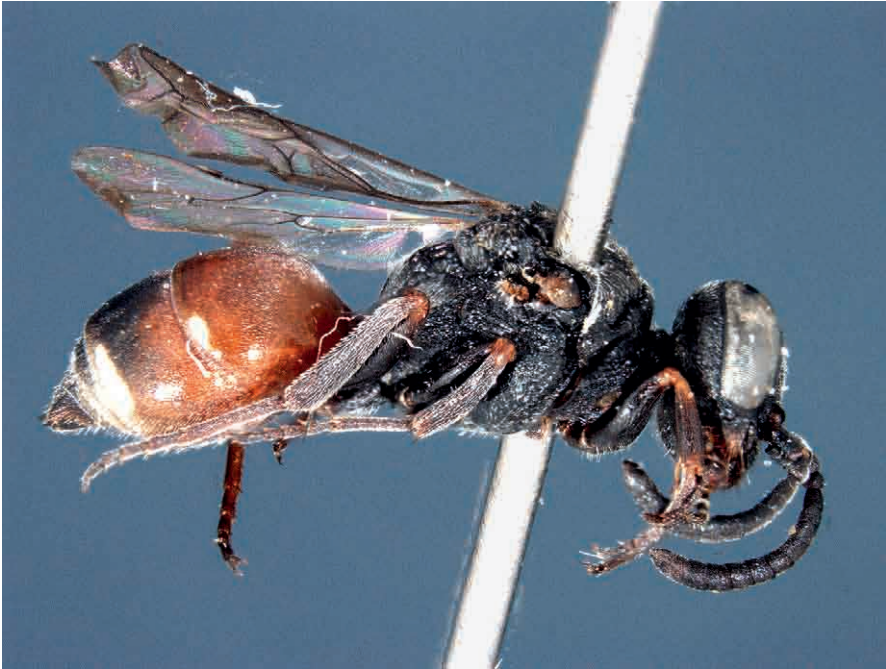
Abb. 2: Die parasitische Grabwespe Nysson ganglbaueri , hier ein Weibchen, ist ausschließlich alpin verbreitet und wird sehr selten gefunden.