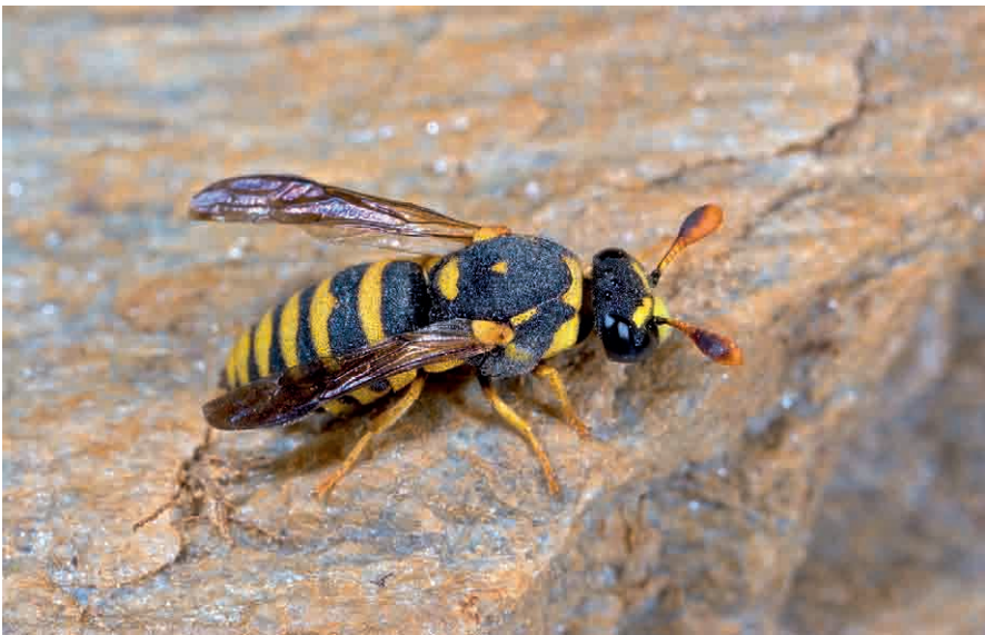
Abb. 3: Celonites abbreviatus , hier ein Männchen, ist eine in Südeuropa weit verbreitete Honigwespenart, die nördlich der Alpen nur sehr punktuell auftritt.