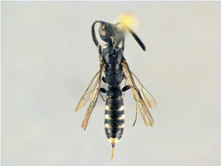
Abb. 1: Sapygina jordanica nov.sp. ♀, Habitus

Der Clypeus (Abb. 2) ist distal abgerundet und relativ grob punktiert, ähnlich der Stirn, aber nicht so dicht. Die Punktzwischenräume glänzen schwach. Die Stirn und der Scheitel sind dichter als der Clypeus punktiert und sie sind durchwegs matt, nur seitlich der Ocellen sind glänzende Punktzwischenräume, wie auf den Schläfen, ausgebildet. Über den Fühlern ist keine Erhöhung zu erkennen. Bei S. kurzenkoi ist über den Fühlergruben eine deutliche Erhöhung zu erkennen. Die Fühler sind schlank und verbreitern sich bis zum Ende nur schwach. Das Pronotum (Abb. 3) ist an den Schultern kurz abgerundet und bei seidigem Glanz fein punktiert. Ähnlich punktiert sind auch die übrigen Abschnitte des Thorax, aber das Schildchen, das Hinterschildchen und der Horizontalbereich des Propodeums weisen stark glänzende Mittelstreifen auf und vor dem Schildchen hat das Mesonotum eine wesentlich gröbere Punktiertung. Die Schenkel glänzen schwach, die Schienen sind durch die dichte Punktuierung matt.