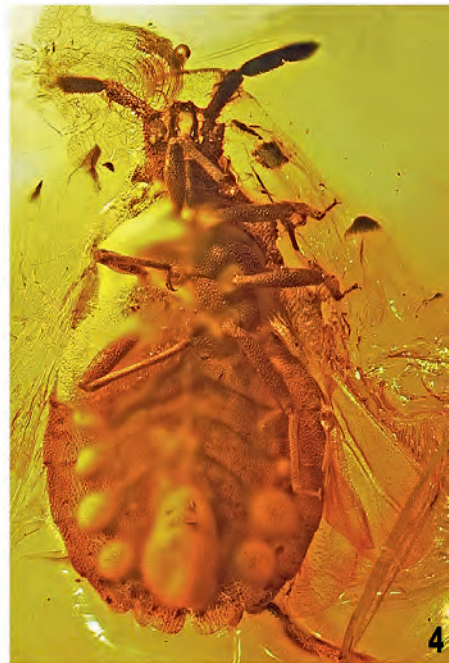
Foto 1-4: Foto der Bernstein Aradus Spezies. (1) Aradus leptosomus nov.sp., Holotypus dorsal; (2) ditto ventral. (3) Aradus rotundiventris nov.sp., Holotypus dorsal; (4) ditto ventral.