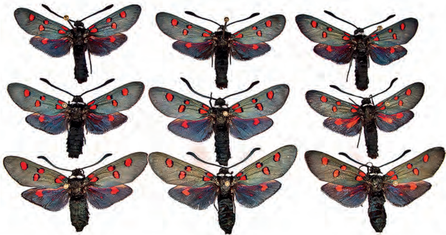
Abb. 24: Populationstypen Z. lavandulae subsp. riomundonis ssp. nov., Albacete, Riopar.