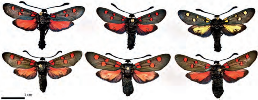
Abb. 4: Populationstypen von Z. lavandulae ssp. jumillensis subsp. nov. 3♂♂ 3♀♀ Alicante, Elche.