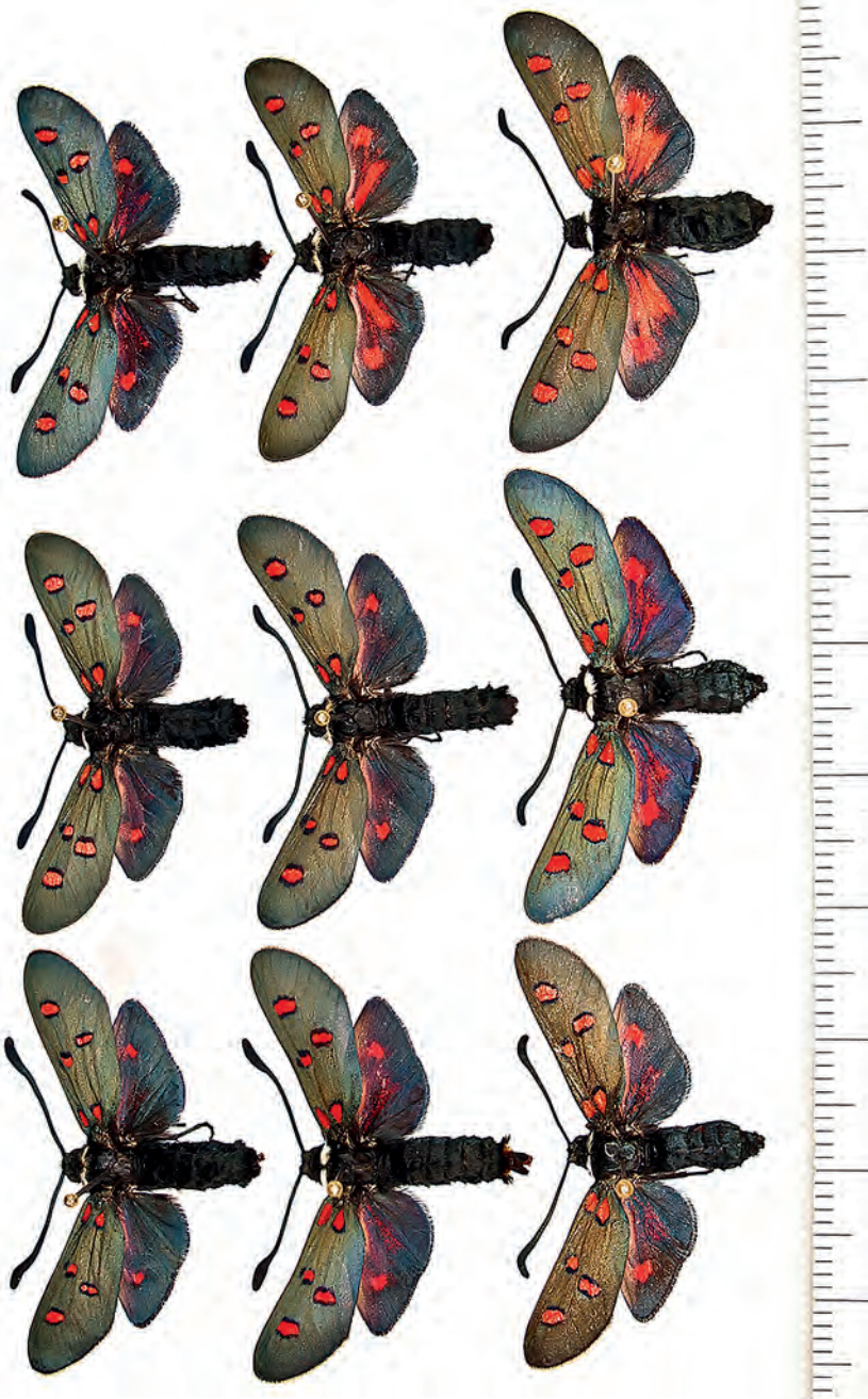
Abb. 21: Populationstyp Z. lavandulae gertrudae Almeria, Albox, Santuario.