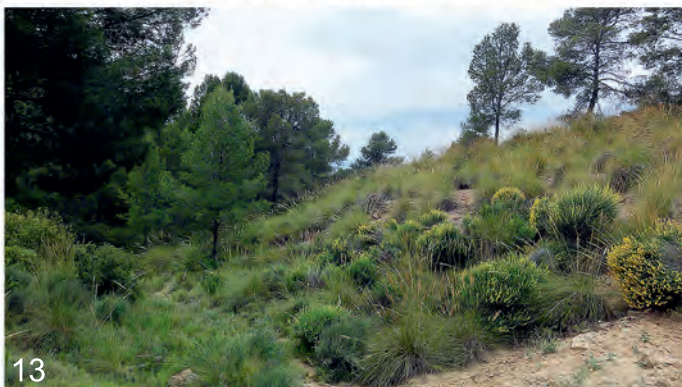
Abb. 11-13: (11) Biotop Murcia, Jumilla, La Celia, Cerricos Negros, V-2007 (Lencina); (12) Biotop Murcia, Jumilla, Sra. del Carche, V-2013 (Aistleitner); (13) Biotop Murcia, Jumilla, Sra. del Carche, V-2013 (Aistleitner).