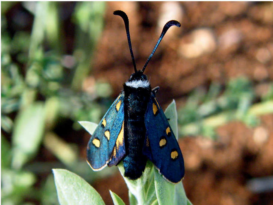
Abb. 1: Zygaena lavandulae jumillensis nov.ssp., f. flava (Santa).

K e y w o r d s : Zygaena lavandulae , Zygaenidae, biogeography, faunistic, Spain, new description: Z. l. jumillensis nov.ssp.and Z. l. riomundonis nov.ssp.