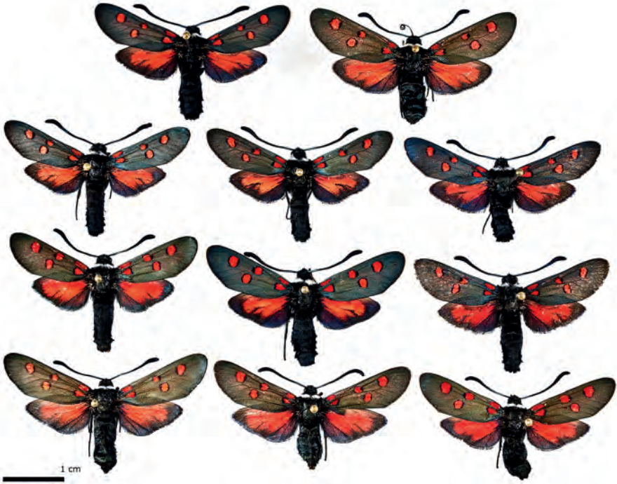
Abb. 3: HT und AT und Populationstypen von Z. lavandulae ssp. jumillensis subsp. nov.