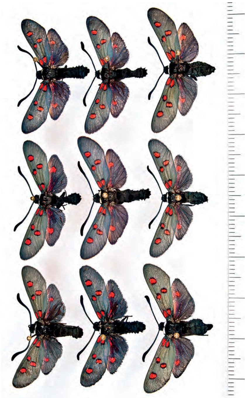
Abb. 22: Populationstyp Z. lavandulae alfacarica , Granada, Sra. de Alfacar.