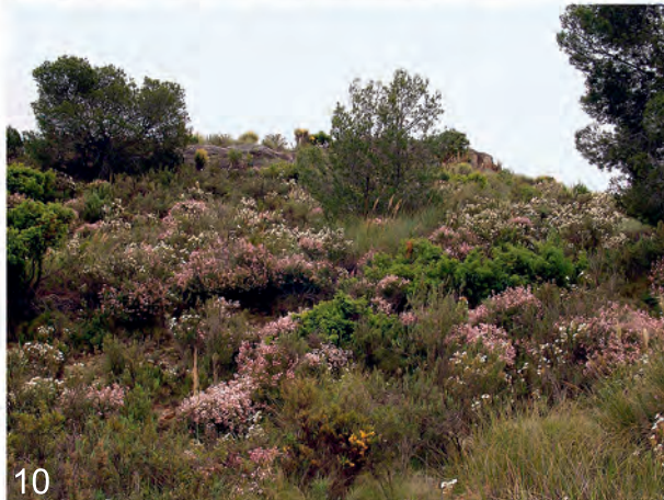
Abb. 8-10: (8) Biotop Valencia, Cofrentes, V-1991 (Aistleitner); (9) Biotop Murcia, Calasparra (Lencina); (10) Biotop Murcia, Cehegin, Sra. de la Puerta (Lencina).