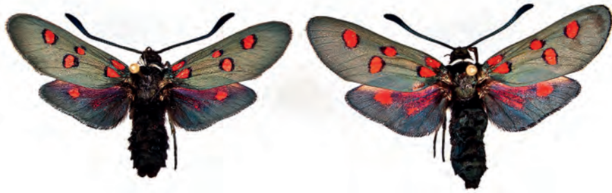
Abb. 23: HT und AT Zygaena lavandulae subsp. riomundonis ssp. nov.