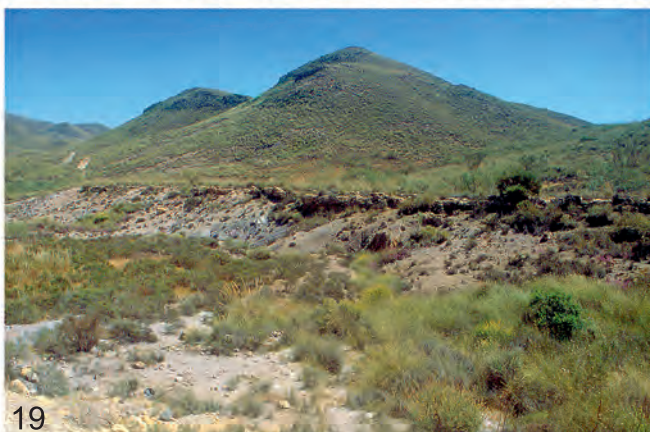
Abb. 17-19: (17) Biotop Murcia, Lorca, IV-1992 (Aistleitner); (18) Biotop Almeria, Albox, Santuario, IV-1992 (Aistleitner); (19) Biotop Almeria, Nijar, Alhamilla, IV-2008 (Aistleitner).