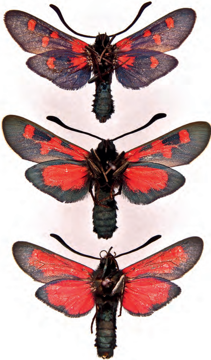
Abb. 2: Unterseiten von drei Phaena von Z. lavandulae (Erklärungen siehe Text Seite 271).