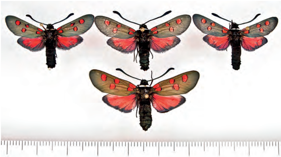
Abb. 5: Z. lavandulae ssp. jumillensis subsp. nov., 3 ♂ 1 ♀, Albacete, Cancaix.