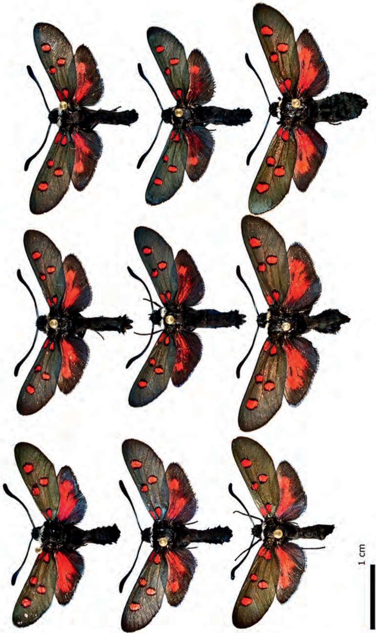
Abb. 20: Populationstype Z. lavandulae hybr., Murcia, Sra. España.