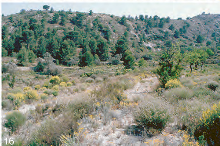
Abb. 14-16: (14) Biotop Albacete, Albatana, V-2013 (Aistleitner); (15) Biotop Albacete, Caudete, V-2013 (Aistleitner); (16) Biotop Alicante, Busot, V-1991 (Aistleitner).