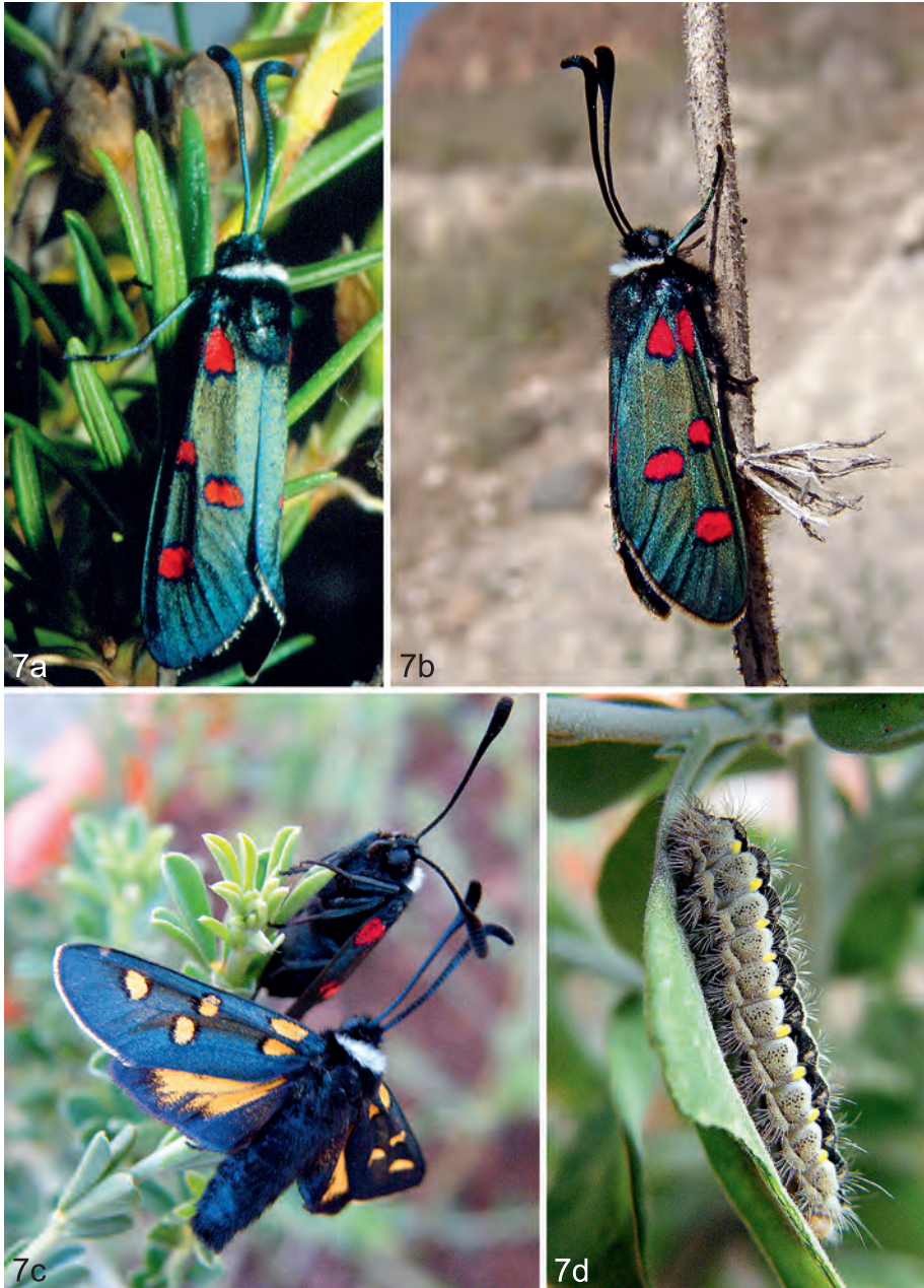
Abb. 7a-d: (7a) Z. lavandulae ssp. jumillensis subsp. nov., Murcia, Jumilla, IV-1998 (Aistleitner); (7b) Z. lavandulae ssp. jumillensis subsp. nov., Albacete, Cancarix, IV-2013 (Lencina); (7c) Z. lavandulae ssp. jumillensis subsp. nov., Elche (Santa); (7d) Raupe von Z. lavandulae ssp. jumillensis subsp. nov., f. flava Elche (Santa).