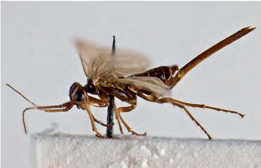
Abb. 2: Xyela helvetica (BENSON, 1961). Körperlänge vom Kopf bis zur Ovipositorspitze 5 mm.

Bemerkung: Die seltene Art wurde von Benson (1961) als Xyelatana n.sp. aus der Schweiz beschrieben, von BLANK et al. (2013) zu Xyela gestellt. Die Art soll sich larval in den männlichen Blüten von Pinus mugo entwickeln. Das ♀ ist der einzige Nachweis der Art in Österreich (SCHEDL 1978, BLANK et al. 2013) und stellt ein alpin-endemisches Faunenelement dar (SCHEDL 1976).