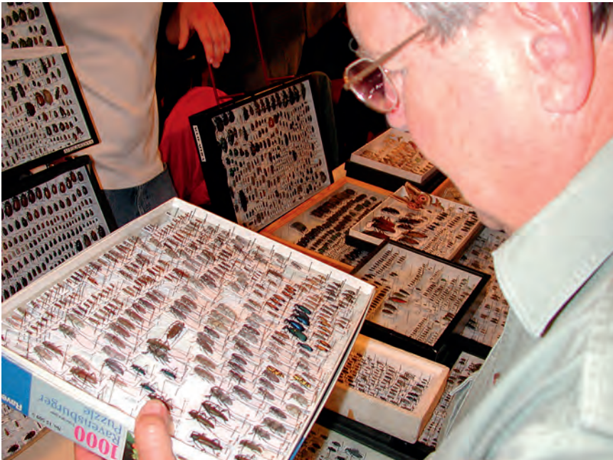
Abb. 9: DD bei einer seiner regelmäßigen Besuchen der Prager Insektenbörsen.