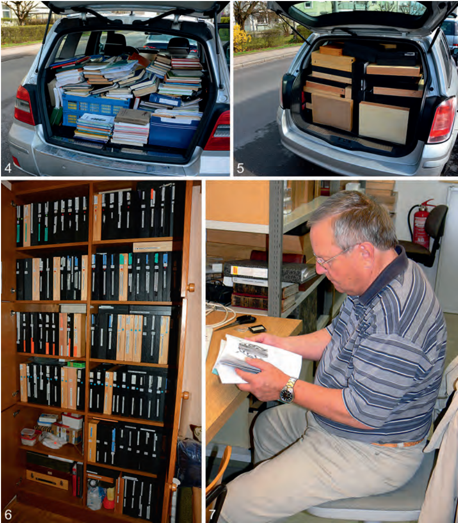
Abb. 4-7: (4-5) Abtransport der Sammlung DD ins Biologiezentrum Linz: (4) Literatur; (5) Cerambycidensammlung; (6) Unterbringung der Sammlung in der Wohnung von DD; (7) DD bei der Arbeit im Biologiezentrum Linz.