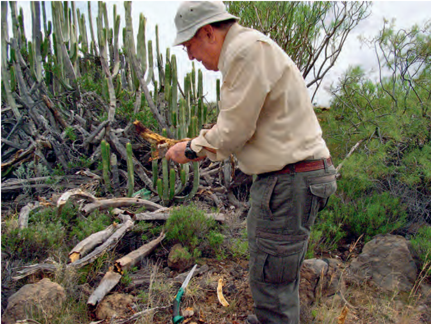
Abb. 8: DD auf einer Exkursion auf den Kanaren.