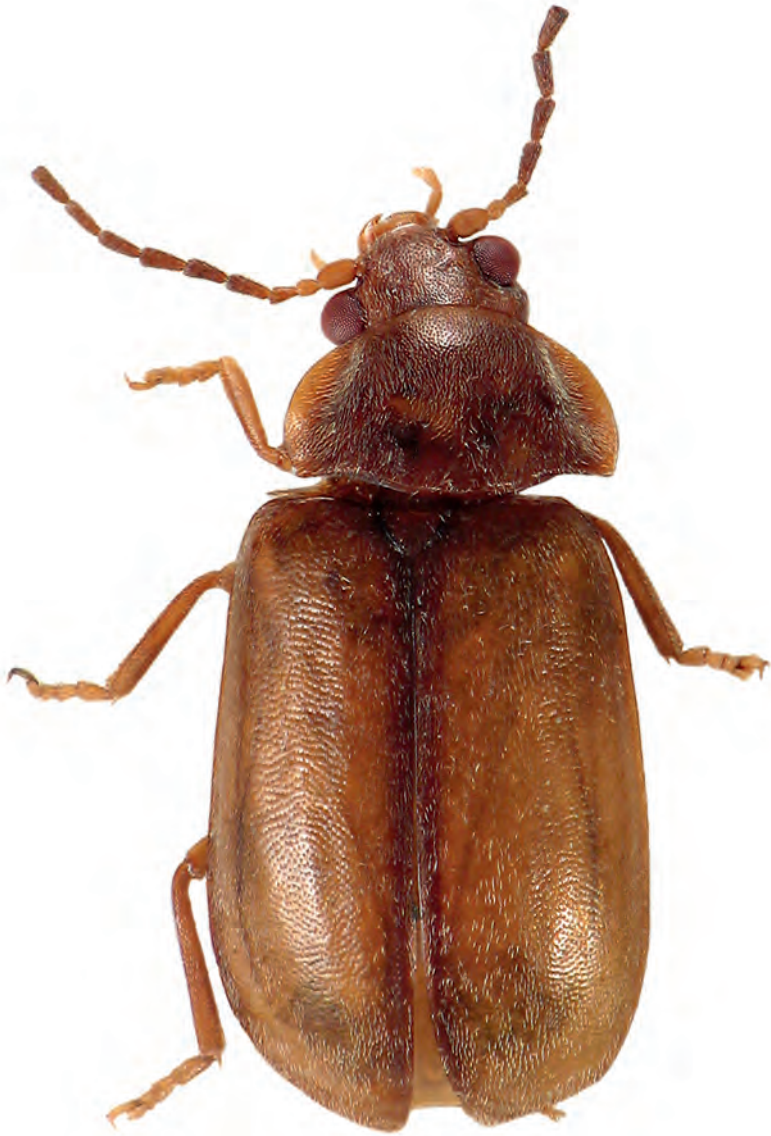
Abb. 5: Microcara explanata , Habitus, dorsal.