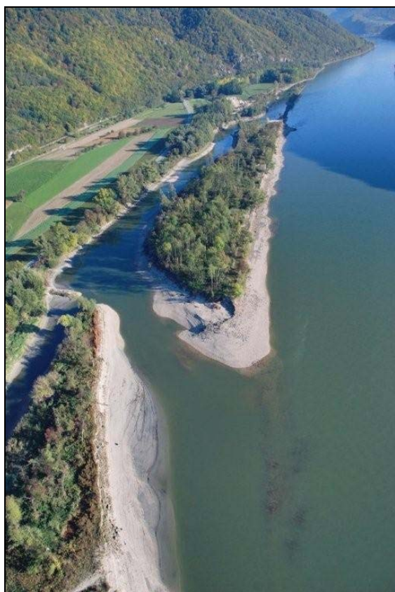
Donau mit Nebenarm bei Grimsing.

nutzungsfrei gestellt und als Naturschutzgebiet „Steinwand“ eingerichtet werden. Flussaufwärts gibt es rechtsufrig bei Spielberg noch einen großflächigen Auwiesenkomplex mit eingestreuten Altbaumbeständen, der als Weidegebiet extensiviert und erhalten werden soll. Damit kann ein durchgehender, ökologisch hochwertiger Flusskorridor vom Naturschutzgebiet „Ofenloch-Neubacher Au“ in Loosdorf bis zur Pielach-Mündung in Melk geschaffen werden.