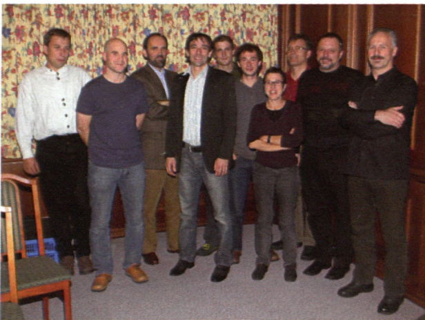
Der neue LANIUS-Vorstand (siehe Text).

Die offizielle Jahreshauptversammlung begann um 19.00 Uhr mit der Eröffnung und Begrüßung der ca. 50 anwesenden TeilnehmerInnen durch den Obmann Thomas Hohebner. Nach der Genehmigung der Tagesordnung standen die Berichte des Kassiers und des Obmannes an der Reihe. Der Kassier Josef Pennerstorfer verliest die wesentlichen Zahlen zur