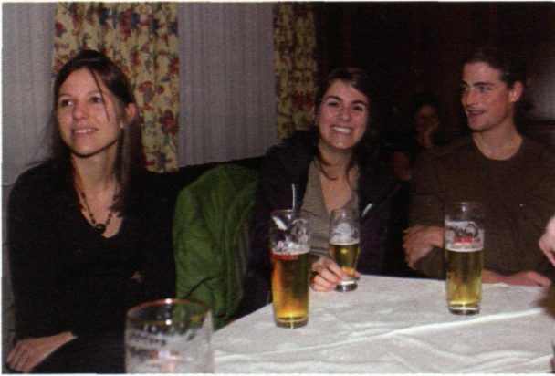
Gut gelauntes junges Publikum, das hoffen lässt.

Im Rahmen der Jahreshauptversammlung wurden die Mitgliedsbeiträge neu festgesetzt und dabei geringfügig von Euro 14,- auf 18,- erhöht. Diese Änderung wurde einstimmig angenommen. Weiters wurden einige kleinere Änderungen zu den Statuten ebenfalls einstimmig angenommen. Diskutiert wurde schließlich die Anregung von Dr. Kraus, eine steuerliche Absetzbarkeit von Spenden an LANIUS zu ermöglichen. Eine genauere Erörterung des Themas wurde vertagt. Der Vorstand wird sich der Angelegenheit annehmen.