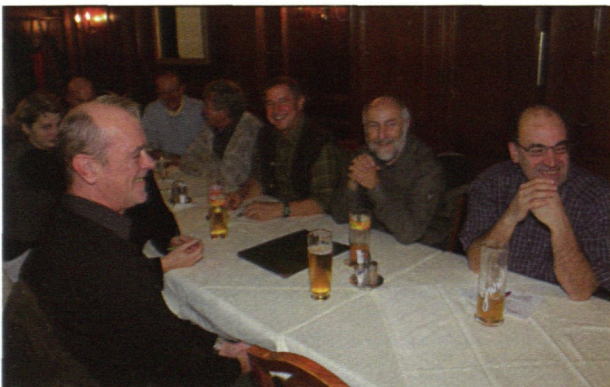
Altgediente LANIUS-Mitglieder, vergnügt ...