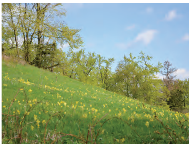
Buchbergwiese im April.