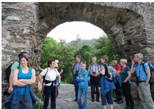
Anmarsch übers Rote Tor.

Am 26.05.2016 wanderten auf den Buchberg bei Spitz über 30 Teilnehmer mit, darunter zahlreiche Kinder. Der Anmarsch führte über das Rote Tor zum Trockenrasen Halteranger bis zum 702 m hohen Buchberggipfel.