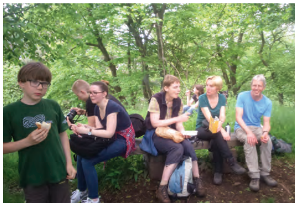
Pause am Buchberggipfel.

Schon am Hinweg entdeckten wir bereits fünf Orchideenarten darunter auch die Hummel-Ragwurz. Auf der Buchbergwiese blühten zahlreiche Exemplare vom Dreizähligen Knabenkraut, Brand-Knabenkraut und der Mücken-Händelwurz. Im neu erworbenen LANIUS-Buchenwald sangen einige Halsbandschnäpper. Dort standen auch die Nestwurz und beide weiße Waldvöglein-Arten.