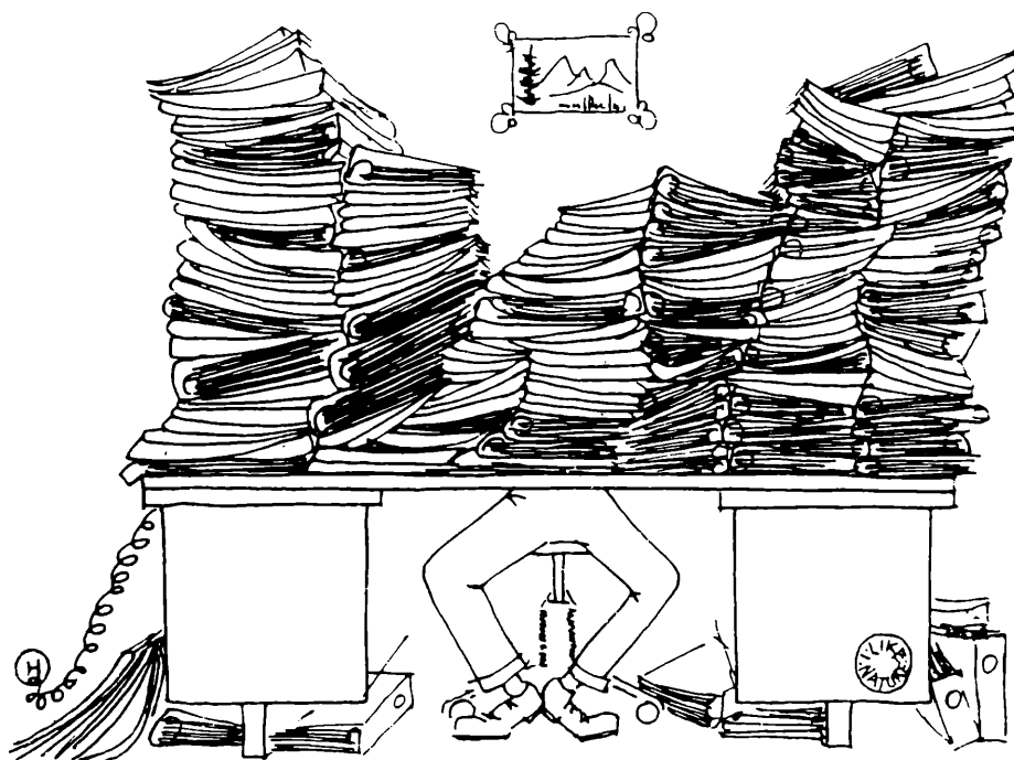
Naturschützer bei der Arbeit

Wie wird denn unterrichtet und informiert über Lebewesen, deren Beziehung untereinander und