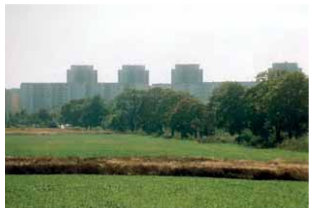
Abbildung 2: „Stadtkaute“ bei Berlin-Hohenschönhausen

Wesentlicher als der Begriff Zwischenlandschaft selbst ist die zunehmende Bedeutung des mit diesem Begriff umschriebenen räumlichen Phänomens, dessen verstärkte Ausprägung auch einen wesentlichen Impuls für die neuere politisch-strategische