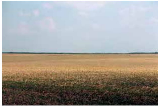
Abbildung 4: Agrarlandschaft der Barnimer Feldmark

Der Regionalparkverein bindet für die Erfüllung öffentlicher Aufgaben der Kulturlandschaftsentwicklung privatwirtschaftlich und zivilgesellschaftlich motivierte Akteure ein; der Ansatz des Regionalparks, den