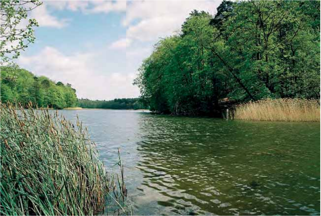
Abbildung 3: Der Hellsee im Naturpark Barnim

turpark Barnim rund um das Wandlitzer Seengebiet (Abbildung 3) ist ein Teilraum mit positiv besetztem Image, während die ausgeräumte Agrarlandschaft der Barnimer Feldmark (Abbildung 4) ein zwar prägnantes, aber eher negativ besetztes Image aufweist.