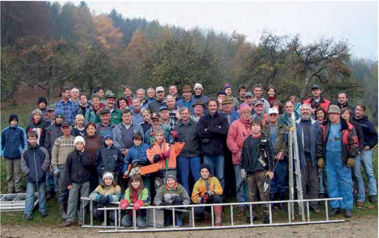
Abbildung 3: Kombinierte Entbuschungs- und Obstschnittaktion in Röckingen November 2007

In begrenztem Umfang konnten bis vor vier Jahren die Bürgeraktionen aus Fördermitteln (Landschaftspflegerichtlinien) des Bayerischen Umweltministeriums über den Landschaftspflegeverband Mittelfranken unterstützt werden. Erstattet wurden hier 75 % der entstandenen Gerätekosten. So wurden Motorsägen und Schlepperstunden nach Maschinenringsätzen bezahlt. Die Kosten für die Verpflegung der Teilnehmerinnen und Teilnehmer (Brotzeit, abschließendes gemeinsames Lammessen) wurden hingegen von beteiligten Gemeinden übernommen, wobei die Schäfereien jeweils ein Lamm spendeten.