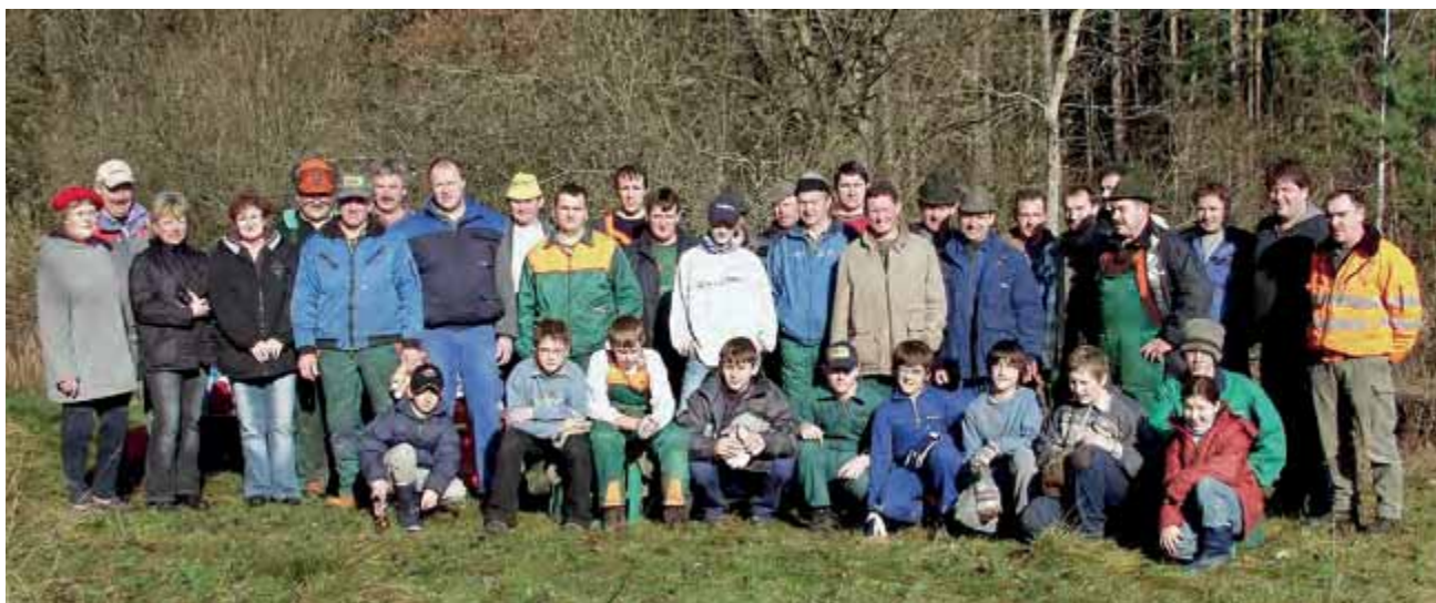
Abbildung 2: Beyerberg, Kappelbuckaktion 2007