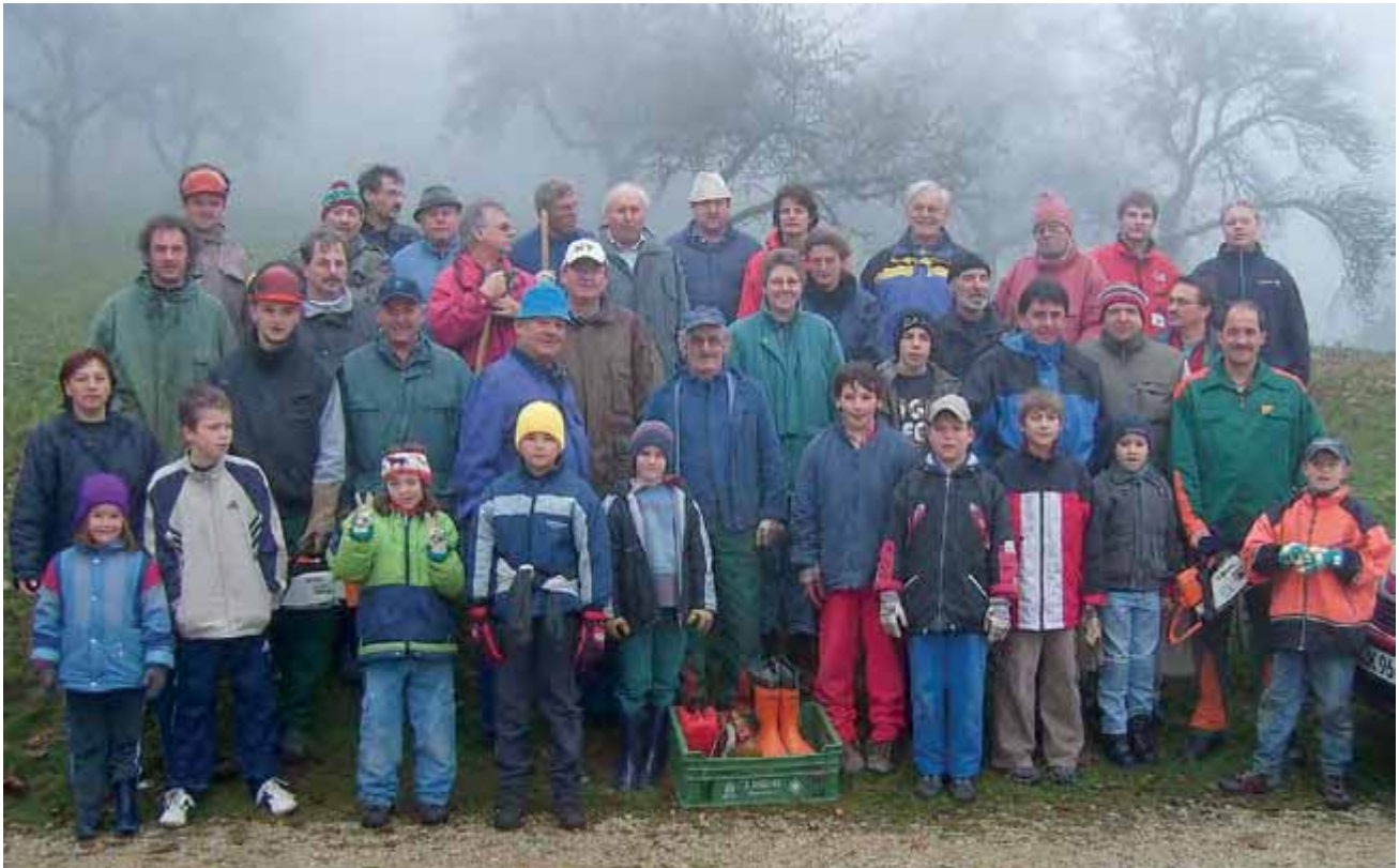
Abbildung 5: Röckingen, Tag für den Berg 2005

Bezugnehmend auf den Titel des vorliegenden Bandes „Die Zukunft der Kulturlandschaft“ kann die vorgestellte Initiative, bürgerschaftliches Engagement für den Kulturlandschaftserhalt, ein zukunftsweisender Schritt sein. Mit kontinuierlichem Betreuungseinsatz kann es gelingen, außergewöhnliche und beispielgebende Bürgerbeteiligungsprojekte dauerhaft zu etablieren. Die Bürgeraktionen zeigen somit einen Weg auf Kulturlandschaftsschutz nicht durch Verordnung, sondern durch aktives und ehrenamtliches Bürgerengagement zu verwirklichen. Dies ist ein wichtiger Schritt in einer zukunftsorientierten und nachhaltigen Naturschutz- beziehungsweise Kulturlandschaftsarbeit. Diese Beispiele auch in andere Gemeinden zu tragen, ist ein wichtiges Ziel der künftigen Arbeit des Landschaftspflegeverbandes Mittelfranken.