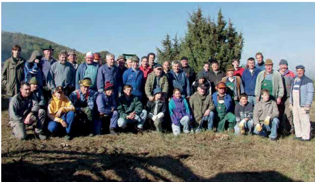
Abbildung 4: Ehingen, Tag für den Berg 2003