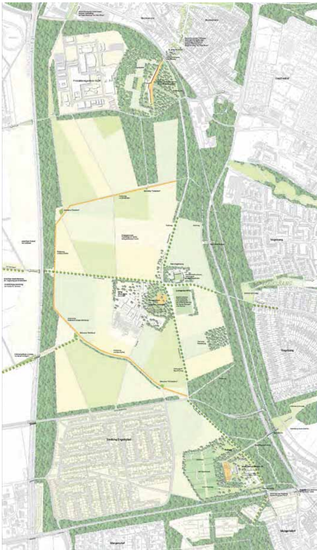
Abbildung 4: Gesamtentwurf Landschaftspark Belvedere, Büro Lohrberg, Stuttgart (Stadt Köln)