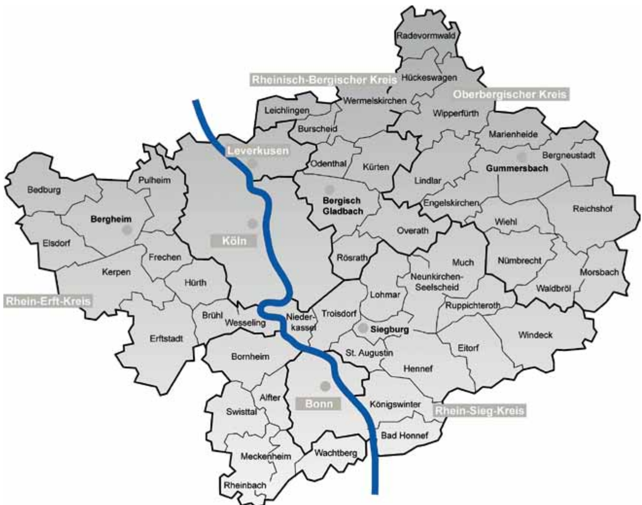
Abbildung 1: Das Gebiet der Regionale 2010 Köln/Bonn (Regionale 2010 Agentur)

territorialen und fachlichen Grenzen ein planerisches Muss. Diesem Ziel gibt der Masterplan :grün eine gemeinsame Vision.