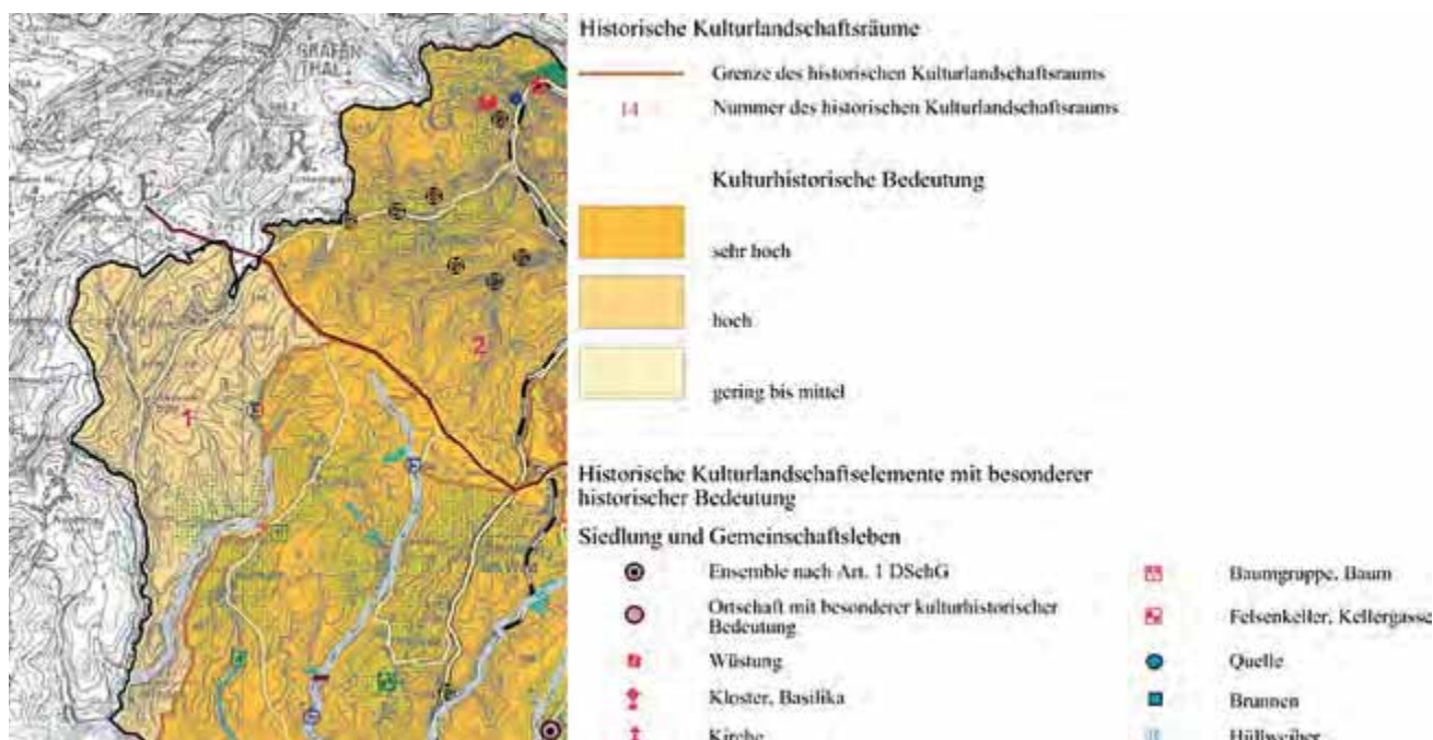
Abbildung 2: LEK Oberfranken West (4), 2004, Ausschnitt aus Karte Nr. 1.6: Schutzgut Historische Kulturlandschaft, Originalmaßstab 1:100.000 (LEK REGION OBERFRANKEN WEST 2004)

lassen sich größtenteils nicht auf die Aussagen der LEKs zurückführen.