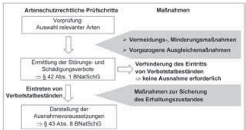
Abbildung 1: Artenschutzrechtliche Prüfschritte

Die behördliche Zuständigkeit für die Prüfung der artenschutzrechtlichen Verträglichkeit beziehungsweise der Erteilung einer Ausnahme gemäß § 43 Abs. 8 BNatSchG liegt nach Maßgabe des jeweiligen Landesnaturschutzrechts in der Regel bei den Naturschutzbehörden 2) . Die Ausnahmegenehmigung stellt jedoch im Allgemeinen nicht die einzige Zulassungsvoraussetzung dar. Die artenschutzrechtliche Ausnahmeentscheidung ist daher regelmäßig zusätzlich neben anderen Entscheidungen, beispielsweise einer Baugenehmigung, zu treffen. Anders stellt es sich in Verfahren mit Konzentrationswirkung wie etwa bei der Planfeststellung oder der immissionsschutzrechtlichen Genehmigung nach § 13 BImSchG dar. In diesen Verfahren ersetzt eine konzentrierte Entscheidung Verwaltungsentscheidungen anderer Be-