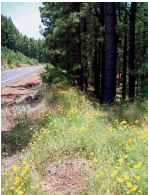
Abbildung 6: Der Kalifornische Mohn ( Eschscholzia californica ) besitzt eine hohe phänotypische Plastizität und kann zum Beispiel seine Gesamtgröße, die Größe von Blüten und Samen sowie den Blühzeitpunkt an die Umweltbedingungen anpassen. Auf Teneriffa hat sich diese Art entlang von Straßen schon fast bis auf 2000 m ü. NN ausgebreitet und droht nun, in den Teide-Nationalpark einzuwandern.

terschiedliches Wachstum von Hoch- und Tieflagenindividuen unter den gleichen Klimabedingungen beobachtet werden konnte. Je nach Art dürfte also sowohl phänotypische Plastizität als möglicherweise auch evolutive Anpassung eine Ausbreitung entlang des Klimagradients ermöglicht haben. Der Zeitbedarf für evolutive Anpassung könnte auch erklären, weshalb länger anwesende Arten höhere Lagen erreichen; wobei auch langsame Ausbreitungsdynamik relevant sein kann.