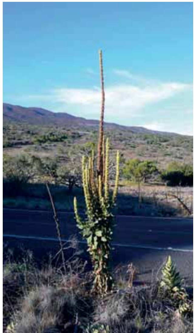
Abbildung 1: Invasion von Kleinblütiger Königskerze ( Verbascum thapsus ) auf ca. 2500 m ü. NN auf dem Vulkan Mauna Kea, Hawaii

Biologische Invasionen sind sehr komplexe Vorgänge. Daher ist es schwierig, generelle Aussagen darüber zu treffen, welche Faktoren den Invasionserfolg einer Art bestimmen (HEGER 2004, KUEFFER u. HIRSCH HADORN 2008). Eine Möglichkeit, ein besseres Verständnis der Invasionen zugrunde liegenden Mechanismen zu gewinnen, ist die Verwendung eines integrativen Forschungsansatzes, der das Zusammenspiel von verschiedenen Faktoren anhand von Beispielen aus unterschiedlichen Regionen vergleicht. Diesen Ansatz verfolgen das Mountain Invasion Research Network (MIREN, www.miren.ethz.ch )