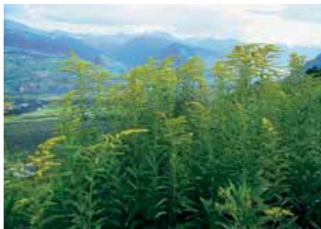
Abbildung 3: Bisher konnten sich Bestände der Kanadischen Goldrute ( Solidago canadensis ) nur bis in mittlere Höhen der Schweizer Alpen ausbreiten. Diese Art könnte aber von vermehrten Störungen und dem Klimawandel profitieren und sich dadurch auch in größeren Höhen etablieren.

Für die europäischen Alpen sind etwa 450-500 gebietsfremde Gefäßpflanzenarten bekannt, was etwa 10% der gesamten Alpenflora entspricht (AESCHI-