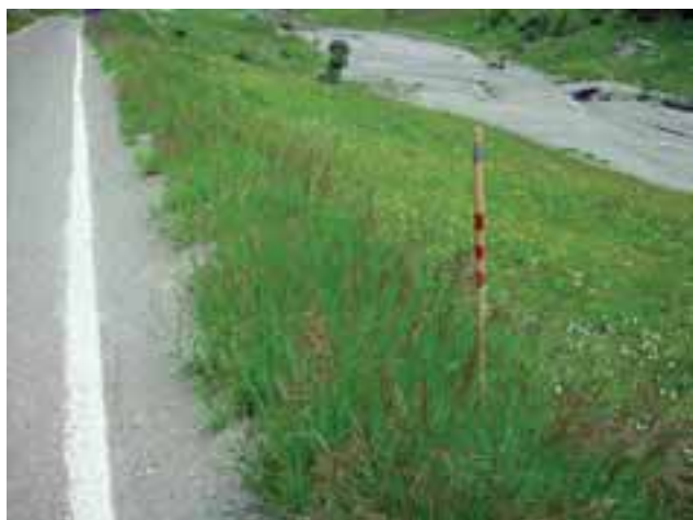
Abbildung 2: Bestand der Unbegrannten Trespe ( Bromus inermis ) im Walliser Val d'Hérens auf ca. 1900 m ü. NN. Die in der Schweiz gebietsfremde Grasart wurde häufig entlang von Straßenrändern angesät.

Eine von MIREN erstellte Datenbank von gebietsfremden und invasiven Pflanzenarten in Gebirgen