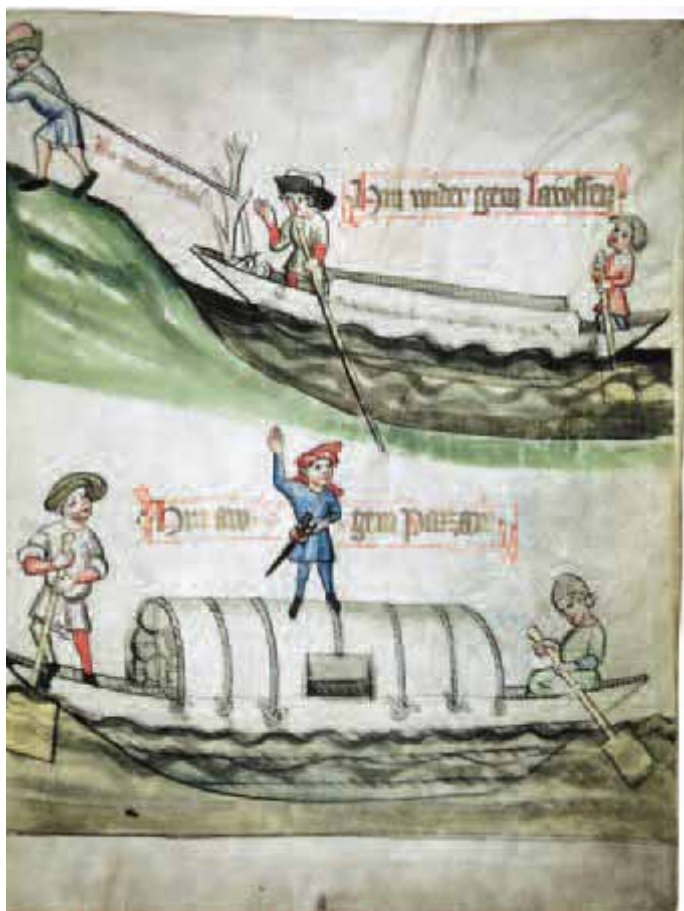
Abbildung 3 (links mitte) Gegenzug (von Menschenkraft) nach Laufen und Naufahrt nach Passau. Aus dem Zech- buch der Passauer Schifflente (1422).