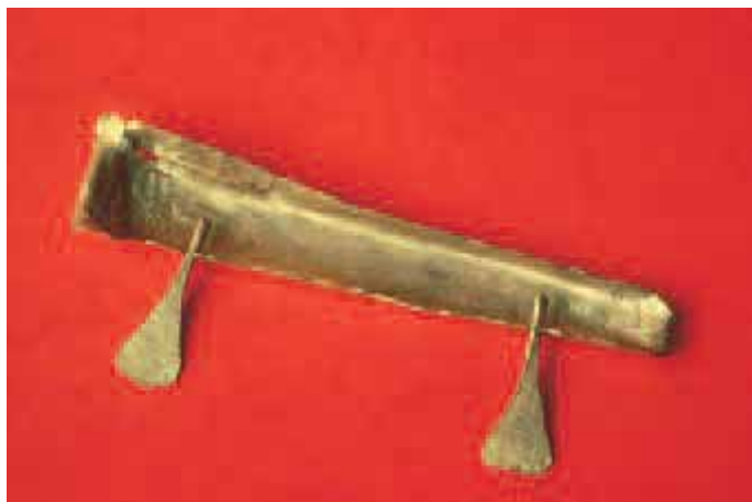
Abbildung 2 Das Goldschiffchen vom Dürrenberg bei Hal- lein (4. Jh. v. Chr.).