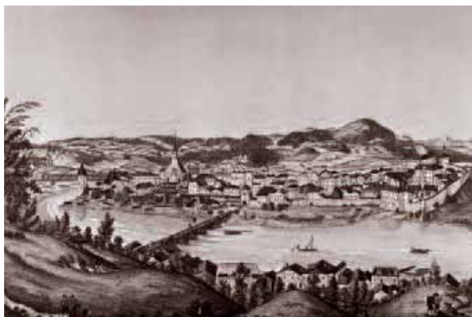
Abbildung 4 (links unten) Laufen an der Salzach, das Zentrum der Salz- schiffahrt.