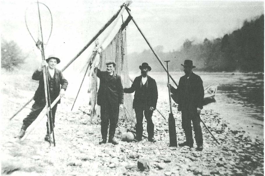
Abb. 3: Salmenfischer bei Ellikon am Hochrhein

Aber die Kiesbänke besitzen nicht nur ihre charakteristischen Pflanzen und Tiere, sondern bildeten früher auch das Tätigkeitsfeld für Menschen von einem ganz besonderen Schläge. Das waren neben den Salmenfischern - an die noch viele alte Flurnamen wie Salmengrund, Salmengrien, Salmenwörth erinnern - vor allem die Golder und Vogler, die Goldwäscher und Entenfänger. Zuerst verschwanden die Goldwäscher, als sich ihr mühseliger Beruf nicht mehr lohnte; einen der letzten von ihnen habe ich 1911 noch bei seiner Arbeit auf einer Kiesbank des Altrheins Philippsburg auch in photographischem Bilde festhalten können.