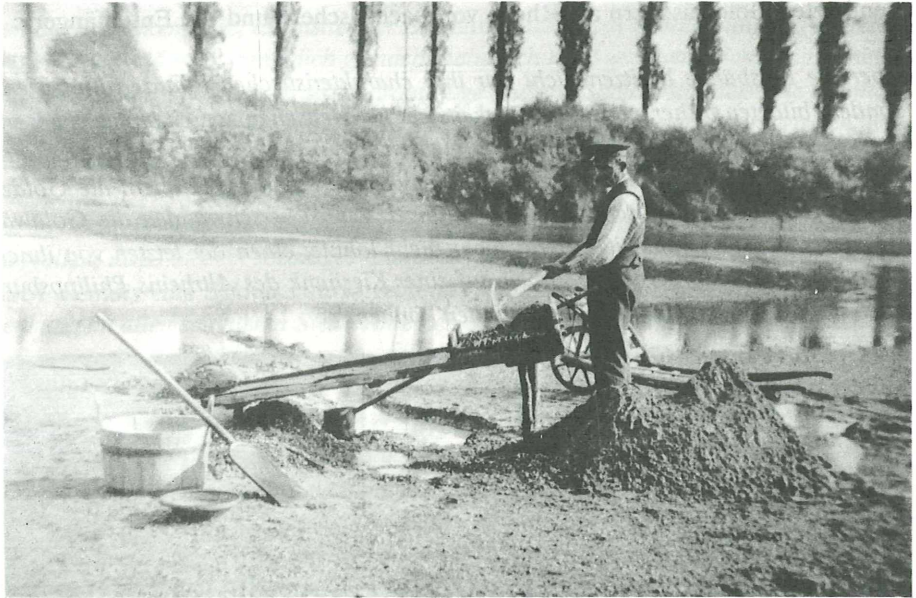
Abb. 4: Einer der letzten Goldwäscher am Rhein, fotografiert von Lauterborn 1911