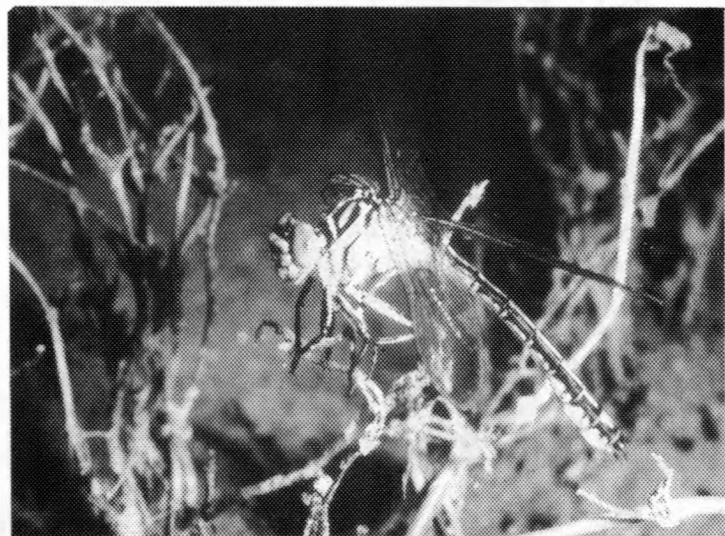
Abb. 1: Stylurus flavipes ♂ mit deformiertem rechten Vorderflügel