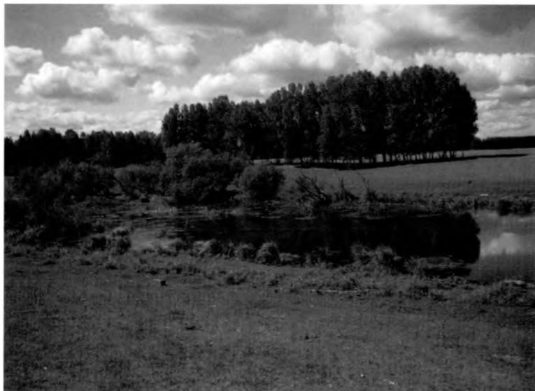
Abb. 1: Das untersuchte Gewässer bei Sedelnikowo, Abschnitte 4 u. 5, Blick von Nordost. – Fig. 1: The observed stretch of water near Sedelnikowo, observation localities 4 and 5, view from north-east.

Die Untersuchungen wurden an einem als Viehtränke angelegten eutrophen Gewässer unweit der Ortschaft Sedelnikowo im Nordostteil des Omsker Regierungsbezirkes (56°57'N, 75°16'E) durchgeführt. Das Gewässer befand sich im Randbereich einer größeren, durch Abholzung und Beweidung entstandenen Wiesenfläche. Das Offenland war in der Umgebung des Gewässers durch einige Birkenhaine unterbrochen, die nach Süden allmählich in eine geschlossene Waldfläche übergingen. Das Gewässer lag in einer in Nord-Süd-Richtung verlaufenden Senke, die im Nordteil durch einen Damm begrenzt wurde. Es war ca. 320 m lang und die Breite betrug im Dammbereich maximal 60 m und in den Abschnitten 3 bis 5 10-15 m. Das relativ flache Gewässer war im Dammbereich maximal 1,7 m, in den übrigen Bereichen maximal 1,5 m tief und stark verschlammmt. Weitere Angaben zur Struktur und zur Vegetation sind in Tab. 1 enthalten.