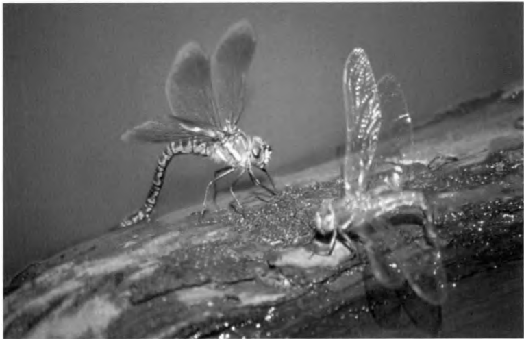
Abb. 2: A. crenata und A. grandis nebeneinander bei der Eiablage in Totholz. – Fig. 2: A. crenata and A. grandis side by side ovipositing in dead wood.

Die einen Eiablageplatz suchenden Weibchen wurden wie die A. crenata -Weibchen von paarungsbereiten Männchen angefliegen und signalisierten diesen ebenfalls durch Einkrümmen des Abdomens ihre Ablehnung. Die Männchen ließen bald darauf von den Weibchen ab. In zwei Fällen wurde ein Weibchen durch das Männchen in die Vegetation und in einem Fall auf die Wasseroberfläche gedrückt. Als das Weibchen auf dem Wasser lag, entfernte sich das Männchen. Erst nach einigen Augenblicken gelang es dem Weib-