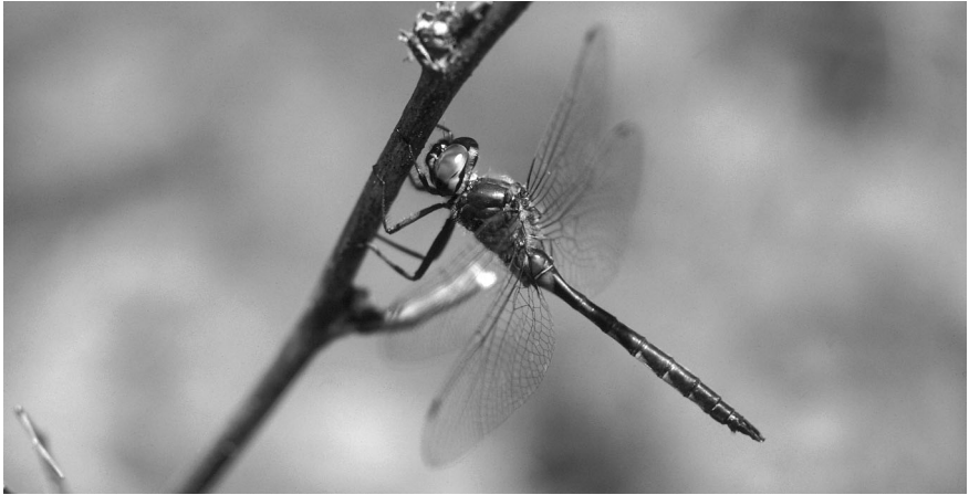
Abbildung 1: Sich sonnendes Männchen von Somatochlora flavomaculata in windgeschützter Lage 70 cm über dem Boden. Der Sitzwinkel beträgt ca. 45°, die Sonnenstrahlen treffen im Bild von oben rechts ungefähr senkrecht auf den Körper ein. Aufnahme vom 17.08.1995 13:45 h Solarzeit, Lufttemperatur 20°C. — Figure 1: Basking male of Somatochlora flavomaculata in a place sheltered from wind 70 cm above ground. Perching angle ca 45°, angle of dorsally incident sun rays ca 90°. Hinwil, Switzerland, 47°19'N, 08°48'E, 17-VIII-1995 13:45 h solar time, air temperature 20°C.