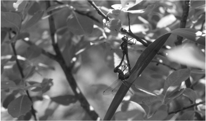
Abbildung 3: Paarungsrund von Somatochlora flavomaculata im Schatten eines Weidenbusches. Aufnahme vom 28.06.2005 12:00 h Solarzeit, Lufttemperatur 31,9°C. — Figure 3: Copula of Somatochlora flavomaculata in the shade of a willow bush. Wetzikon, 28-VI-2005 12:00 h solar time, air temperature 31.9°C.