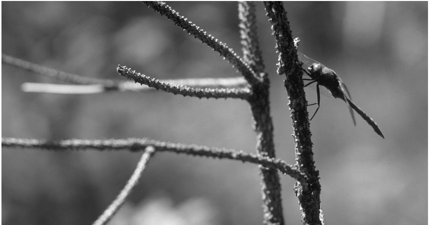
Abbildung 2: Ruhendes Männchen von Somatochlora flavomaculata im Schatten eines dünnen Fichtenzweiges 80 cm über dem Boden. Die Sonnenstrahlen treffen im Bild von oben links ein, die Körperachse der Libelle ist gegen die Sonne gerichtet. Aufnahme vom 28.06.2005 10:30 h Solarzeit, Temperatur 29,3°C. — Figure 2: Perching male of Somatochlora flavomaculata on the shaded side of a dry spruce twig 80 cm above ground. The body axis of the dragonfly is directed towards the sun. Wetzikon, Switzerland, 47°19'N, 08°48'E, 28-VI-2005 10:30 h solar time, air temperature 29.3°C.