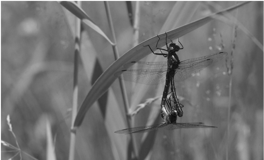
Abbildung 4: Paarungsrund von Somatochlora flavomaculata im Schatten eines Schilfblattes. Aufnahme vom 12.07.2001 13:00 h Solarzeit, Lufttemperatur 25°C. — Figure 4: Copula of Somatochlora flavomaculata in the shade of a reed blade. Wetzikon, 12-VII-2001 13:00 h solar time, air temperature 25°C.