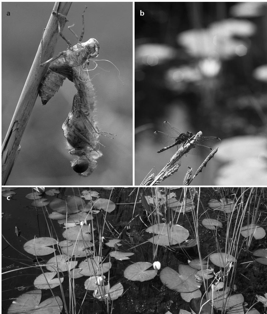
Abbildung 2: Habitatpräferenz von Leucorrhinia pectoralis . (a) Der Schlupf findet an emersen Vegetationsteilen statt, meist 5-20 cm über der Wasseroberfläche oder direkt am Gewässerrand. (b) Die fortpflanzungsaktiven Männchen sitzen auf waagrechten oder schiefen Vegetationsteilen, von wo aus sie die Wasseroberfläche überwachen und auf Weibchen warten. (c) Als ideale Rendezvousplätze erweisen sich verlandende Torfstiche mit dunkelbraun erscheinenden Wasserflächen, die locker mit Vegetationsteilen durchsetzt sind. — Figure 2: Habitat preference of Leucorrhinia pectoralis . (a) The emergence takes place on vertical or slightly oblique substrate 5-20 cm above the water surface or directly at the pond's edge. (b) Reproductively active males perch at the water on horizontal or slightly oblique vegetation where they wait for females. (c) Former peat-diggings with dark brown water of which the surface is interspersed by plants are ideal rendezvous sites for L. pectoralis .