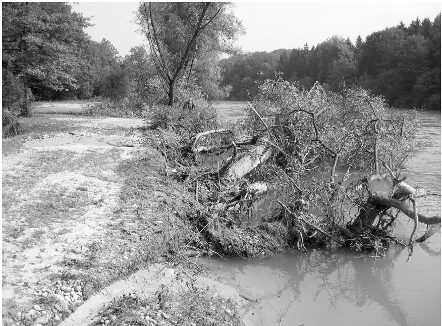
Abbildung 4: Derselbe Reussabschnitt wie in Abb. 3 nach dem Hochwasser vom 22.08.2005. Die umgestürzten Bäume wurden zur Bereicherung der Uferstrukturen belassen. — Figure 4: The same section of the river Reuss as in Fig. 3 after flooding on 22-viii-2005. The fallen trees were left untouched to enrich the structural diversity of the banks.

wärts im Abschnitt A beliefen sich die Werte auf 2,0 bzw. 0,3 und 0,2. Vergleichsweise hoch ( O.c. 22,8; O.f. 6,8; G.v. 2,0) waren die Exuviendichten im Abschnitt C.