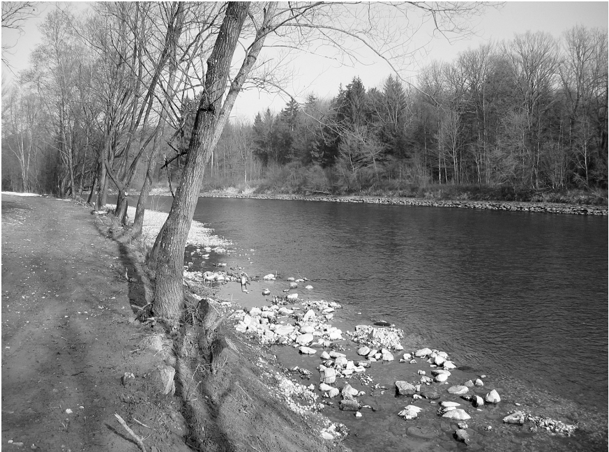
Abbildung 3: Renaturiertes Ufer der Reuss bei Mühlau (Projekt 1) nach Abschluss der Bauarbeiten im Februar 2005. — Figure 3: Revitalized bank of the river Reuss near Mühlau (project 1) after completion of the constructions in February 2005.

Projekt 1. Am linken Reussufer im Grenzgebiet Merenschwand/Mühlau wurde im Februar 2005 auf einer 350 m langen Strecke des Abschnitts B (vgl. Tab. 2) der Hartverbau – Blocksatz und Betonquader – entfernt. Ziel der Maßnahme war, die Flussdynamik zu fördern und der Entwicklung von natürlichen Ufern Raum zu geben. Bereits im August desselben Jahres stürzten bei Hochwasser einige randständige Bäume um und blieben, weil sie speziell gesichert waren, wie beabsichtigt im Uferbereich liegen (Abb. 3 und 4). Noch vor dem Hochwasser wurde in diesem Abschnitt – ähnlich wie an der sich weiter flussaufwärts anschließenden Strecke – eine relativ geringe Anzahl Exuvien von Ophiogomphus cecilia und Onychogomphus forcipatus gefunden, Gomphus vulgatissimus fehlte vollständig (Tab. 2). Von Abschnitt B wurde nur rund ein Drittel renaturiert, der Rest blieb unverändert verbaut. Die Erhebung erfolgte deshalb an beiden Teilstrecken separat. Dabei ergaben sich im Artenspektrum keine Unterschiede und die Anzahl der Exuvien war in beiden Sektoren ähnlich gering. Im 350 m langen renaturierten Teil von B betrug die Exuviendichten pro 100 m Uferlänge bei O. cecilia 3,4, bei O. forcipatus 0,3 und bei G. vulgatissimus 0. Flussauf-