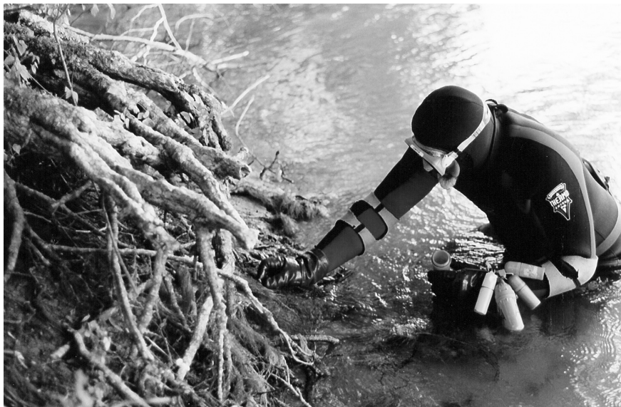
Abbildung 2: Exuviensuche am Flussufer im Taucheranzug. Die Exuvien werden vom Schlüpfsubstrat abgesammelt und in wasserdichten Behältern aufbewahrt. — Figure 2: Collection of exuviae on the river bank by using a diving suit. The exuviae are taken from the emergence substrate and preserved in waterproof boxes.

Wie schon bei früheren Untersuchungen (VONWIL & OSTERWALDER 1994, OSTERWALDER 2004, VONWIL & OSTERWALDER 2006) wurden die Flussstrecken in Sektoren von ca. 1 km Länge unterteilt und alle Exuvienfunde in diesen Abschnitten für die Statistik zusammengefasst. Die Streckeneinteilung erfolgte meist nach Geländemerkmale wie Brücken, Waldrändern oder Gebäuden, die vom Wasser her gut zu erkennen waren.