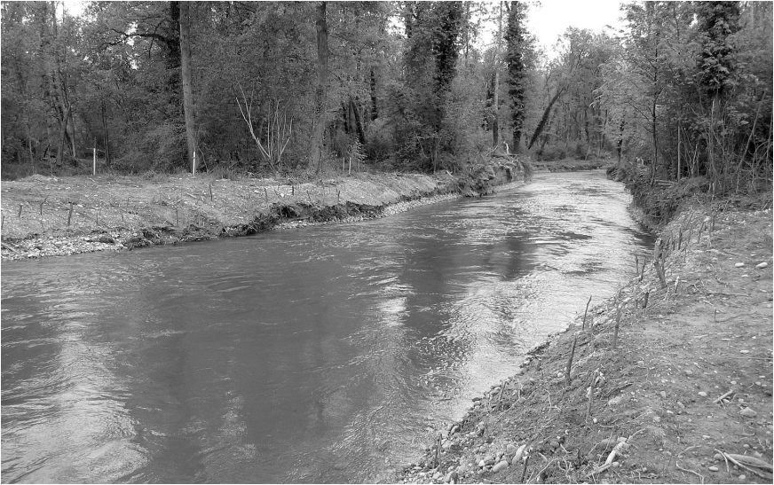
Abbildung 5: Neu gebauter Seitenarm (Projekt 5) kurz nach dem Einlauf aus der Reuss bei Eggenwil (Aargau, Schweiz) bei hohem Wasserstand im Mai 2005. — Figure 5: Newly constructed side branch (project 5) of the river Reuss near Eggenwil (Aargau, Switzerland), shortly after the influx from the river, with high water level in May 2005.