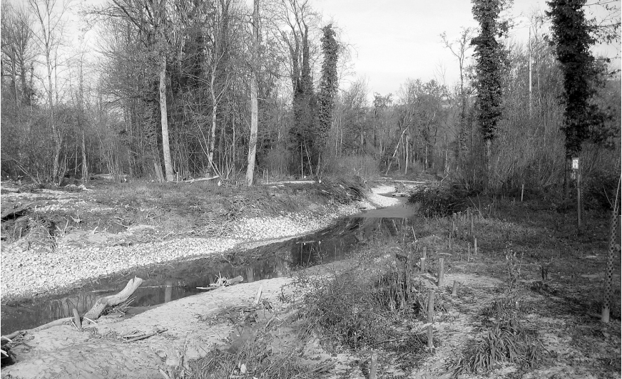
Abbildung 6: Neuer Seitenarm der Reuss wie in Abb. 5 bei niedrigem Wasserstand im November 2005. Das Flussbett besteht hauptsächlich aus Kies. — Figure 6: New side branch of the river Reuss as in Fig. 5, with low water level in November 2005. The streambed consists mainly of gravel.