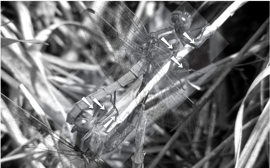
Abbildung 1: Paarungsrade von Orthetrum coerulescens mit je drei Milbenlarven von Leptus sp. an den Beinen von Männchen und Weibchen. Die Pfeile markieren die auf dem Farbfoto leuchtend rot-orangen Milben. Hinwil, Kanton Zürich/Schweiz, 04.06.2007. — Figure 1: Copulation wheel of Orthetrum coerulescens with three larvae of the terrestrial mite Leptus sp. on the legs of the male and female, respectively. The arrows point to the mites that are reddish-orange on the colour photograph. Hinwil, canton Zürich/Switzerland, 04-vi-2007.