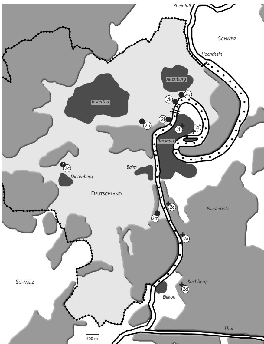
Abbildung 2: Detaillierte Darstellung der historischen Nachweise von Onychogomphus uncatus am Hochrhein zwischen Rheinau und Ellikon (1886-1991). Die Ziffern entsprechen den Fundorten (FO) in Tab. 1. — Figure 2: Detailed presentation of the historic records of Onychogomphus uncatus on the High Rhine River between Rheinau and Ellikon (1886-1991). The numbers correspond to the localities (FO) in Table 1. ● in Deutschland/in Germany; + in der Schweiz/ in Switzerland; ■ aktuell Wald, currently forest.