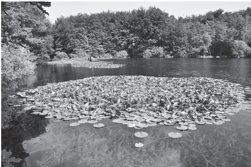
Abbildung 2: Das Villenhofer Maar, Entwicklungsgewässer von Leucorrhinia caudalis in der Tagebaufolgelandschaft der Ville südwestlich von Köln, Nordrhein-Westfalen (13.06.2009). – Figure 2: The ‘Villenhofer Maar’, breeding water of Leucorrhinia caudalis in the strip mining reclamation area of the ‘Ville’ near Cologne, North Rhine-Westphalia, Germany (13-vi-2009).