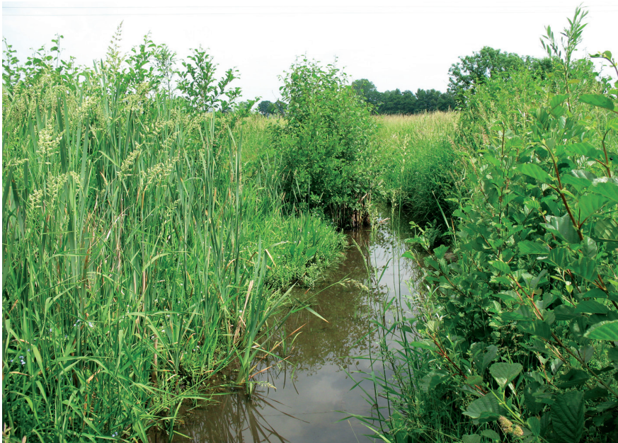
Abbildung 4: Coenagrion mercuriale -Gewässer im Kreis Minden-Lübbecke (NRW), Teilgebiet Espelkamp (19.06.2013). – Figure 4. Coenagrion mercuriale water in the Minden-Lübbecke district (NRW), sub area Espelklamp (19-vi-2013).