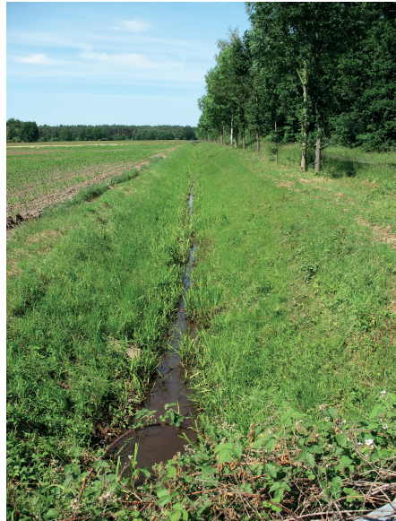
Abbildung 3: Coenagrion mercuriale -Gewässer im Kreis Minden-Lübbecke (NRW), Teilgebiet Mehner Bruch (02.06.2011). – Figure 3. Coenagrion mercuriale water in the Minden-Lübbecke district (NRW), sub area Mehner Bruch (02-vi-2011).