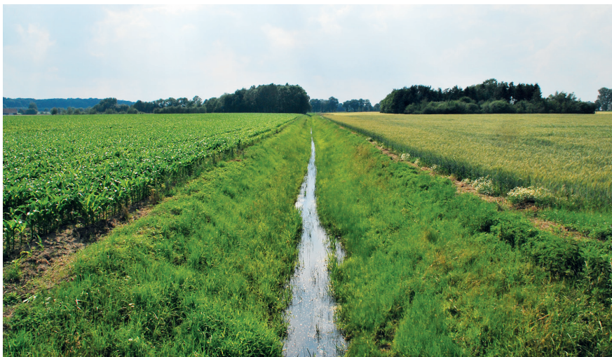
Abbildung 2: Coenagrion mercuriale -Gewässer im Kreis Minden-Lübbecke (NRW), Teilgebiet Ilwede (12.06.2011). – Figure 2. Coenagrion mercuriale water in the Minden-Lübbecke district (NRW), sub area Ilwede (12-vi-2011).