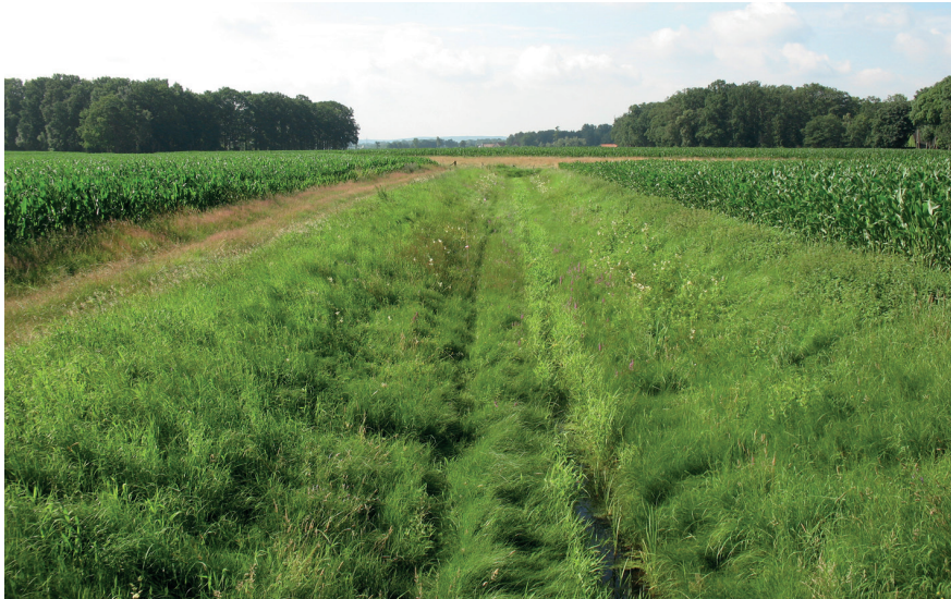
Abbildung 1: Coenagrion mercuriale -Gewässer im Kreis Minden-Lübbecke (NRW), Teilgebiet Tiefenriede (10.07.2012). – Figure 1. Coenagrion mercuriale water in the Minden-Lübbecke district (NRW), sub area Tiefenriede (10-vii-2012).