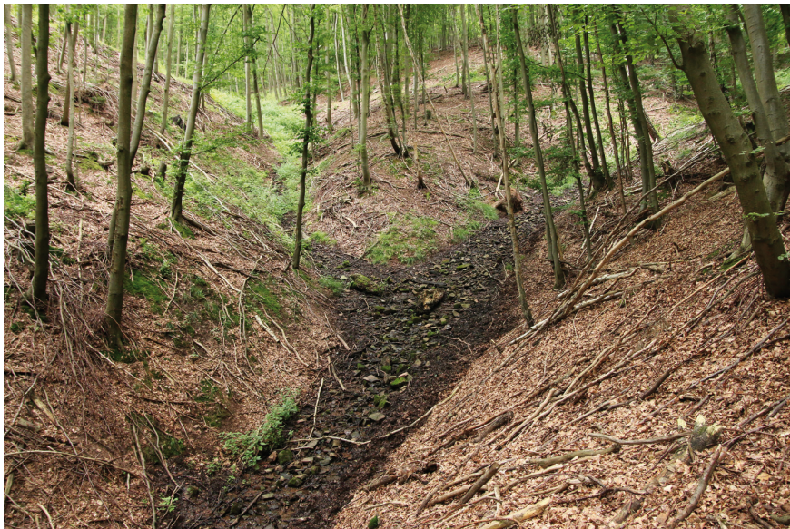
Abbildung 2: Blick auf den Zusammenfluss des nördlichen Hauptquellastes des Tiefen Grabens (Abschnitt A) mit dem Nebenquellast (Abschnitt B). Dort beginnt bachaufwärts der Bachabschnitt mit den meisten Exuvienfunden (08.08.2017). – Figure 2. View of the confluence of the northern main stream branch of Tiefer Graben (section A) and its smaller affluent (section B); upstream from there most exuvia were found (08-viii-2017).

Der Bachuntergrund ist im Oberlauf des Tiefen Grabens, von den Quellen bis hinab zur Querung des unteren Hauptweges, sehr steinig. Etwa 70 % der Fläche war dort von 2 bis 20 cm großen Steinen oder Steinplatten bedeckt. In den obersten Steilstrecken nahm der Steinanteil auf über 90 % zu (Abb. 3). Dazwischen lagerte flachgründig ein helles, schluffig-feinsandiges Substrat, das teils fest, teils grabförmig war. Das anstehende Gestein bot sich aber klüftig und spaltenreich dar.