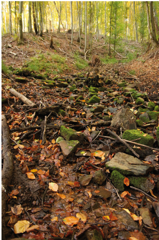
Abbildung 3: Das extrem steinige Bachbett des oberen Hauptquellastes des Tiefen Grabens (unteres Ende des Abschnitts A); dort wurden keine Larven, aber quellwärts zahlreiche Exuvien gefunden (16.10.2017). – Figure 3. The very stony streambed of the upper main branch of Tiefer Graben (section A seen from its lower end); no larvae have been found there but many exuviae (16-x-2017).