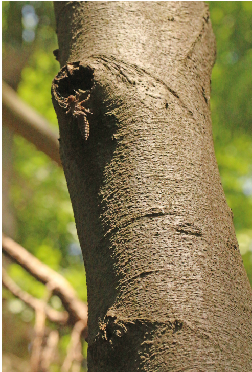
Abbildung 4: Exuvie der Cordulegaster bidentata an einem Buchenstamm am Tiefen Graben in 2,20 m Stammhöhe; auch an Baumstämmen werden möglichst Schlupfplätze mit Überdachung gewählt (28.05.2018). – Figure 4. Exuvia of Cordulegaster bidentata found on a tree trunk at the stream Tiefer Graben; emergence sites with roofing are selected for preference (28-v-2018).

Demzufolge saßen die Exuvien beim Vorhandensein geeigneter ufernäher Strukturen gleich nahe am Bach in Stauden oder totem Astmaterial. Fehlten dagegen solche ufernäheren Strukturen, dann saßen die Exuvien auf den nächstbesten, allerdings weiter vom Bach entfernt liegenden Strukturen, meist auf lebenden oder toten Baumstämmen. Dort saßen sie dann deutlich höher (Abb. 4) – von einem Fall auf einem Baumstubben abgesehen. Alle gefundenen Exuvien saßen auf der dem Bach zugewandten Seite oder lateral gegen diesen versetzt, keine auf der dem Bach abgewandten Seite.