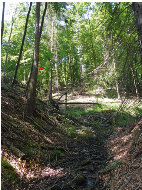
Abbildung 6: Die beiden höchstgelegenen Fundplätze von Exuvien der Cordulegaster bidentata am Tiefen Graben auf einer Lärche in 4,20 m und 3,50 m Stammhöhe (rote Pfeile) (14.06.2018). – Figure 6. The two uppermost positions of exuviae of Cordulegaster bidentata both found on the same larch trunk at a height of 4,20 m and 3,50 m resp. (see the red pointers) (14-vi-2018).

Der höchste Sitzplatz lag auf dem kahlen Stamm einer alten Lärche in 4,20 m über dem Boden und 6,70 m über dem Bachniveau (Abb. 6). Der Baum stand in