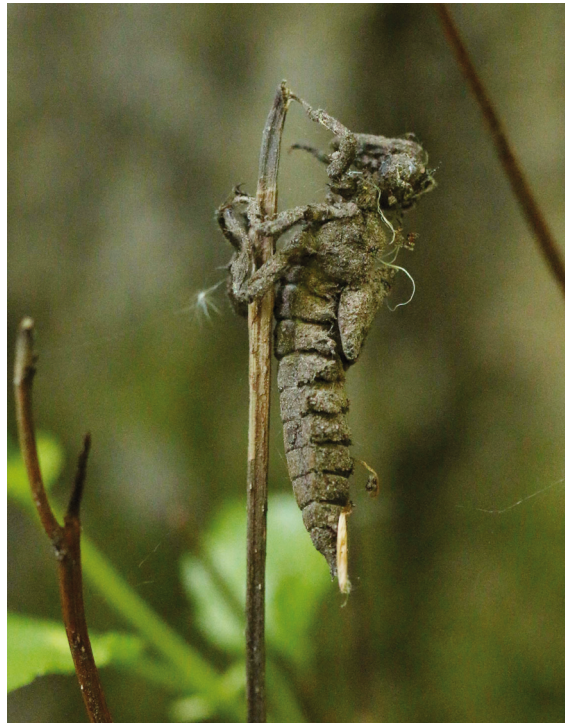
Abbildung 7: Exuvie der Cordulegaster bidentata auf wurzelnahem Seitentrieb der Schwarz-erle Alnus glutinosa am Tiefen Graben (21.05.2018). – Figure 7. Exuvia of Cordulegaster bidentata found on a low branch shoot of Black Alder Alnus glutinosa at the stream Tiefer Graben (21-v-2018).

Auf kleinerem Totholz, wie Einzelästen, Reisig und Stubben, wurden weitere 17 % der Exuvien gefunden. Auf lebenden und toten Baumstämmen saßen schließlich 12 % der Exuvien.