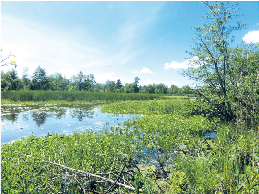
Abbildung 2: Alter Torfstich mit ausgedehnten Beständen von Stratiotes aloides im Großen Moor bei Ladzin; Habitat von Aeshna viridis, Aeshna isoceles und Leucorrhinia pectoralis (09.06.2019). – Figure 2. Old peat ditch with large quantities of Stratiotes aloides ; habitat of Aeshna viridis, Aeshna isoceles und Leucorrhinia pectoralis (09-vi-2019).

Die häufigsten Arten, bezogen auf Artvorkommen \times Gewässeranzahl/100, waren 1970–76 mit \geq 70\% Lestes sponsa , Ischnura elegans , Coenagrion pulchellum , C. puella . Die häufigsten Arten 2018–2019 mit \geq 70\% waren Orthetrum cancellatum , Libellula quadrimaculata , I. elegans , C. puella , Cordulia aenea , Brachytriton pratense , C. pulchellum , A. mixta und Anax imperator .