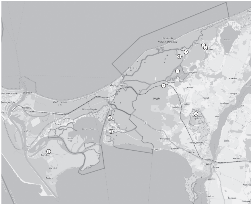
Abbildung 1: Die Lage der Untersuchungsgewässer auf der Insel Wollin – Figure 1. Location of the studied water bodies on the island of Wollin (Kartengrundlage: OpenStreet-Maps 2020). 1 Weiher bei Karsibór, 2 Türkissee, 3 Vietziger See bei Wicko, 4 Luniewo See, 5 Czajcze See, 6 Wiselka Moor, 7 Wiselka See, 8 Kleiner Recze See, 9 Recze See, 10 Großes Moor bei Ladzin.

5) Czajcze See (Jezioro Czajcze): 77,64 ha, im Mittel 3 m tief. Schwimmblattvegetation (Große Teichrose Nuphar lutea , Weiße Seerose Nymphaea alba ). In den Uferbereichen dominiert Ufer-Segge Carex riparia . MUSIAL (1977) gibt 72,5 ha Größe und 4,5 m Tiefe an.